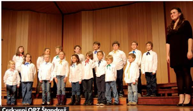
Cerkveni OPZ Štandrež