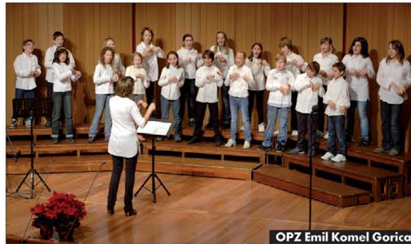
OPZ Emil Komel Gorica