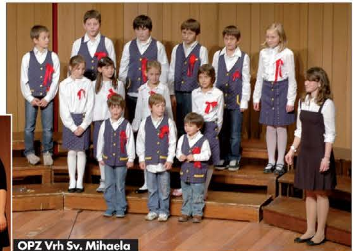
OPZ Vrh Sv. Mihaela