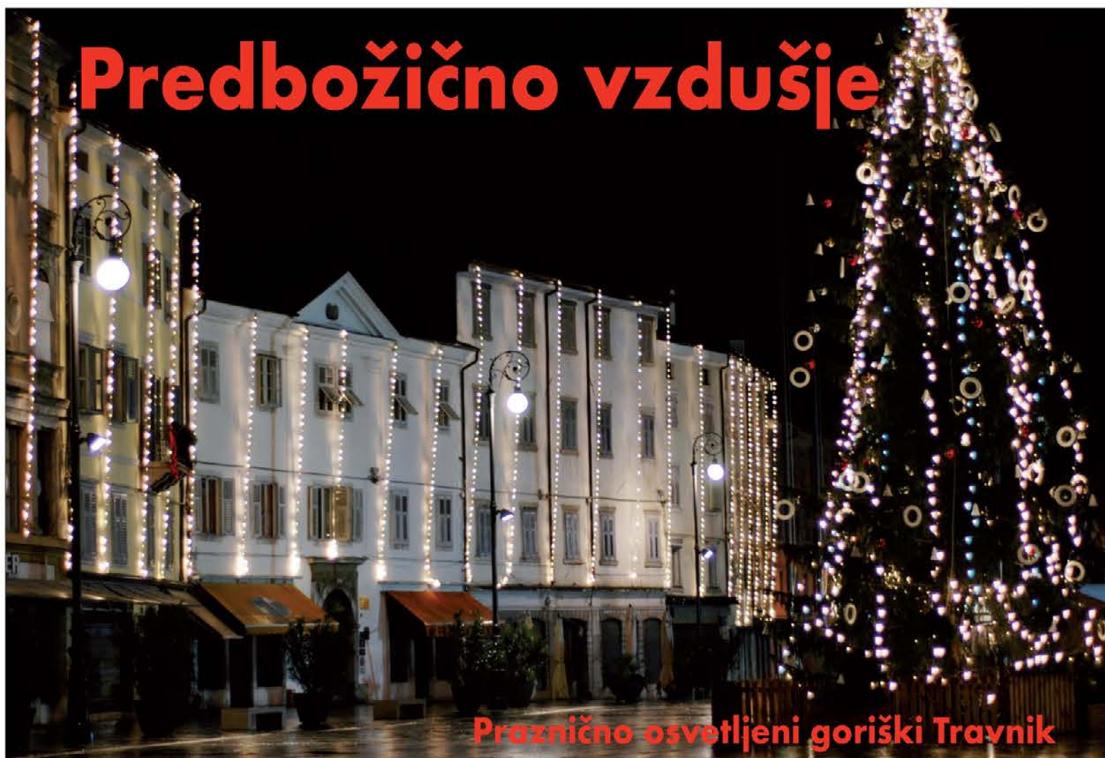
Praznično osvetljeni goriški Travnik