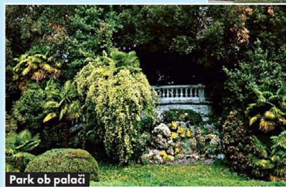
Park ob palači

rojstna hiša Juliusa Kugyja (1858-1944), znamenitega planinca in planinskega pisatelja. Kugy je sicer bil Tržačan, toda v času njegovega rojstva je v Trstu razsajala kolera. Na hiši je vzidana spominska plošča, ki sta jo tja dali postaviti italijansko planinsko društvo in planinsko društvo iz Beljaka. V parku so večkrat koncerti.