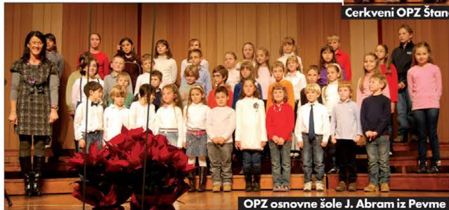
OPZ osnovne šole J. Abram iz Pevme