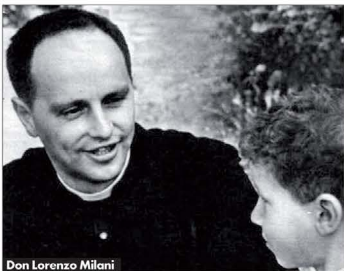
Don Lorenzo Milani

"Vera je nekaj izrednega - je Božji dar, ki sveti v tebi tudi takrat, ko sonce zaide".