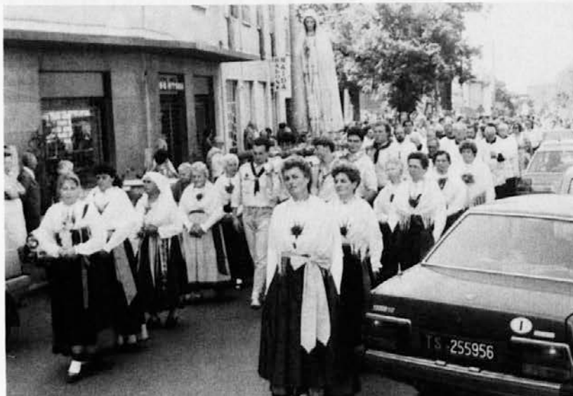
Procesije po openskih ulicah za letošnji 44. Marijanski shod se je udeležilo lepo število ljudi. Veliko je bilo tudi narodnih noš

skih stvarih se več ne pogovarja, ni skupnega bogoslužja. Ni čudno, če potem najdemo včasih tudi nesnago moralne revščine, zanikanje življenja in se katero teh oskrunjenih svetišč tudi podere,« je med drugim dejal g. Vončina ter pozval, da moramo vsi prispevati k obnovitvi naših svetišč. Če družinski člani pripadajo različnim veroizpovedim, je treba probleme reševati s spoštovanjem do prepričanja drugih, a obenem z lastno versko trdnostjo. Več časa pa je treba posvetiti skupni molitvi, ki pa ne sme biti prazna, formalna, je še opozoril škofov vikar, zadnje besede pa je namenil številnim prisotnim skavtom. Priporočil jim je, naj si prizadevajo, da bodo njihove družine zopet postale cerkev v malem, »ne le kraj, kamor boste prihajali le jest in spat, ampak svetišče, kjer boste našli duhovno moč, da boste zunaj uspešneje kljubovali viharjem življenja...«