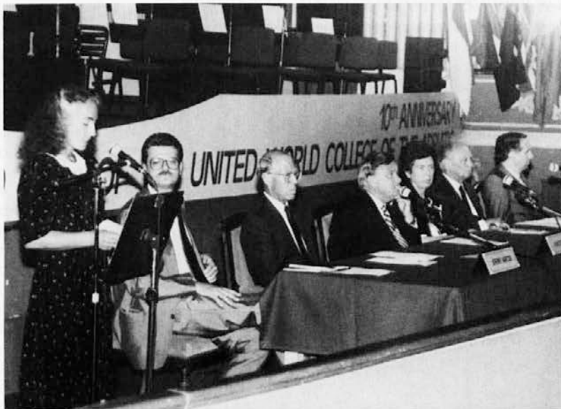
Predstavniki zavoda združenega sveta v Devinu na slovesnosti na Pomorski postaji v Trstu ob 10-letnici