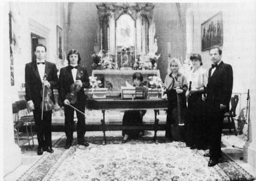
Nastopajoči na prvem letošnjem koncertu iz niza »Repentabor«