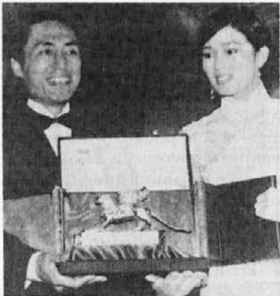
Na sliki: režiser Zhang Yimou z zlatim levom in Gong Li, ki je dobila priznanje kot najboljša igralka.

Čeravno razpolaga festivalska struktura le z nekaj dvoranami (dotrajana Filmska palača iz 30. let, pokrita arena »Palagalileo«, zasilni projekcijski dvoran v Casinòju in v Hotelu Excelsior), napram gigantskim in