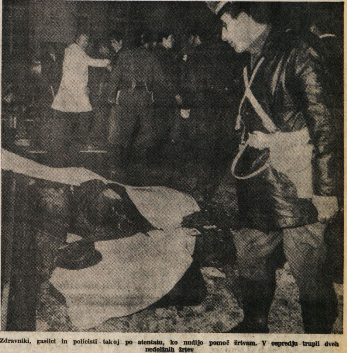
Zdravniki, gasilci in policisti takoj po atentatu, ko nudijo pomoč žrtvam. V ospredju trupel dveh nedolžnih žrtev

Stanje rimskih ranjenecv se medtem izboljšuje. Od štirinajstih oseb, ki so se morale zaradi eksplozije v banki zateči po zdravniško pomoč, so samo tri pridržali v bolnišnici.