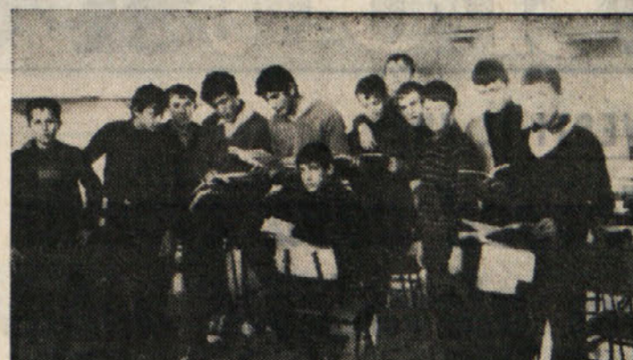
Marijevičji v učilnici