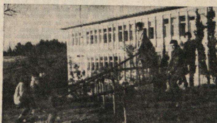
Deklice in... deček na gugalnici