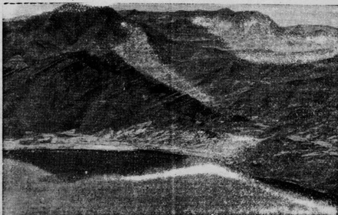
Med Makalo in Deslejem leži v Abesiniji jezero Ašangi. Naselbine v njegovi bližini so bile zadnji čas ponovne cilj italijanskih bombnih napadov.