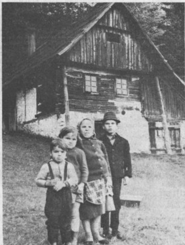
Vrtačnikova družina pred podirajočo Slobško kočjo