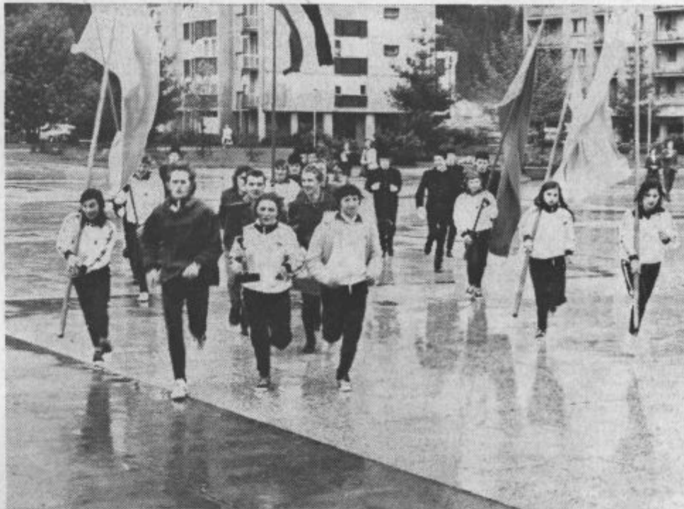
Prihod štafete mladosti na Titov trg v Velenju

Pred odhodom so obljubili, da bodo za naš časnik napisali vtise s popotovanja. In