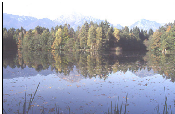
Motiv z drugega grajskega ribnika s Storžičem v ozadju

Zgodovinska vez med potoki in ribniki je v mnogočem povsem podobna zgodovinski vezi med gozdom in travniki. Oboji so nastali zaradi človekovega predrugačenja naravnih razmer, s čemer so se v dobršni meri spremenile življenjske razmere. Po delnem uničenju prvotnega biotopa je nastal nov, z drugačnim ekosistemom. Čprav vrstna pestrost tako nastalih habitatov ne dosega pestrosti v primerljivih habitatih naravnih biotopov (jasa, mlaka), se je v celoti gledano vrstna pestrost s popestritvijo življenjskih okolij vendarle povečala. To pa je konec koncev bilanca vseh naravnih katastrof, pri čemer človekovo kultiviranje narave ni nikakršna izjema.