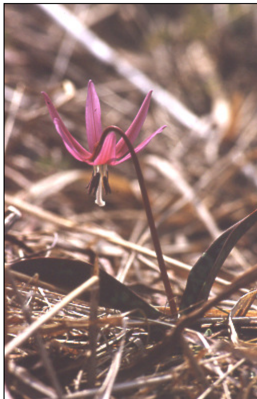
Pasji zob Erythronium dens-canis

schampsia caspitosa , značilna cvetnica pa je spomladi lepljiva kadulja Salvia glutinosa , pozno poleti pa jesenski podlesek Colchicum autumnale . Na suhem travniku Stegne (87 vrst) prevladuje sejana ječmenasta stoklasa Bromus hordaeceus , pogosti pa sta tudi spomladi trpežna ljulka Lolium perenne in navadna latovka Poa trivialis , poleti pa rdeča bilnica Festuca rubra in lasasta šopulja Agrostis tenuis . Spomladanska značilnica je navadna marjetica Bellis perennis , poletna krvavordeča srakonja Digitaria sanguinalis . Na močvirnatem travniku ob Beli (92 vrst) prevladujeta plazeča zlatica Ranunculus repens in sivozeleno ločje Juncus inflexus , značilna rastlina pa je njivski osat Cirsium arvense . V celoti je bilo na brdskih travnikih popisanih 155 vrst praprotnic in semen. 37