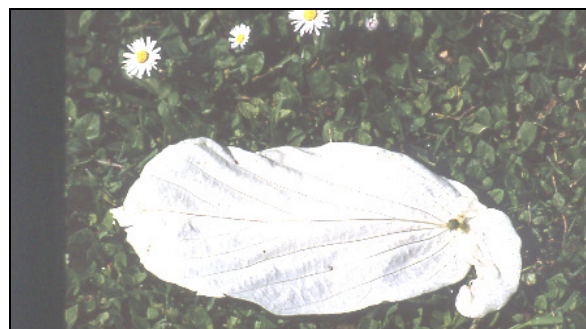
Cvetno odevalo davidije Davidia involucreta

Danes rastejo v grajskem parku v ožjem pomenu besede (brez ribnikov z zaledjem) drevesa in grmovja 45 vrst, od katerih je 8 samoniklih, vse druge so eksote, skupaj približno 450 grmov in dreves. 58 V drevoredih so nanizane ameriške lipe Tilia americana (79 dreves), beli gabri Carpinus betulus (133 dreves) in t.im. rdeči kostanji Aesculus carpinus X carnea (79 dreves), ki so pravzaprav križanci med navadnim A. hippocastanum in rdečim divjim kostanjem A. pavia .