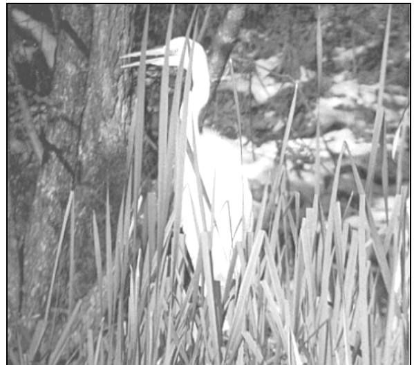
Velika bela čaplja Egretta alba redno prezimuje na Brdu

250 parov, in pupkov takole: navadni pupek Triturus vulgaris ca. 150 osebkov, planinski pupek Triturus alpestris ca. 80 osebkov in veliki alpski pupek Triturus carnifex ca. 30 osebkov. Po slovenskem rdečem seznamu so ranljive vrste: alpski veliki pupek Triturus carnifex , planinski pupek Triturus alpestris , navadni pupek Triturus vulgaris , hribski urh Bombina variegata , navadna krastača Bufo bufo , zelena krastača Bufo viridis , zelena rega Hyla arborea , rosnica Rana dalmatina in sekulja Rana temporaria . Alpski veliki pupek in hribski urh sta tudi na seznamu Sveta Evrope (Habitatno vodilo, Dodatek II).