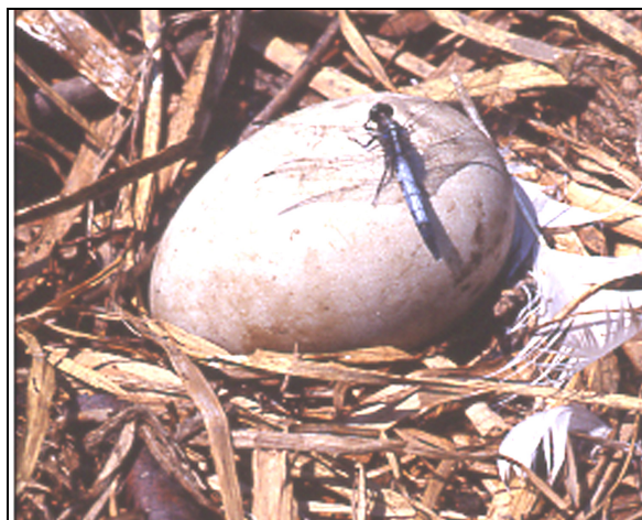
Črni modrač Orthetrum albistylum na jajcu laboda grbca Cygnus olor

V izvirih, potokih in ribnikih je bilo popisanih 23 vrst mehkužcev Molusca: 50 od tega 13 vrst polžev Gastropoda in 4 vrste školjk Bivalvia . Sedem vrst polžev pripada družini hidrobid Hydrobiidae, dva družini svitkov Planorbidae in trije družini pljučarjev Lymnaeidae, dve vrsti školjk pripadata družini unionid Unionidae in dve družini grašcev Sphaeridae. Posebno zanimive so najdbe inkrustriranih troglobiontskih polžkov rodov Iglica in Hauffenia v nekaterih izvirih, kar kaže na podzemne povezave z brdskim zaledjem. Najštevilnejši mehkužec je slikarski škrtček Unio pictorum , ki se množično pojavlja v spodnjem toku potoka Vršek. Na slovenski rdeči seznam so kot redke vrste uvrščeni polži Belgrandiella kuesteri , Bythinella robiciana in Radix auricularia .