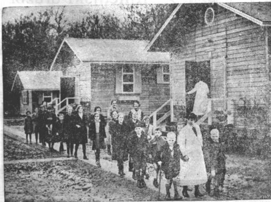
Angleži so svoje otroke iz velikih mest spravili v udobna in varna taborišča na kmetih, kamor upajo, da ne bo seglo vojno radejanje.

Vsakomur, ki bo ta naš opomin prezrl, bomo neljubo primorani ustaviti nadaljno pošiljanje Kmetškega lista.