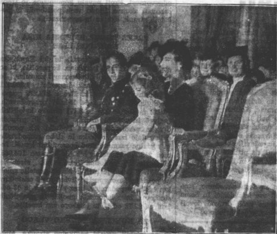
Podobno našim božičnicam imajo Srbi kot predbožično proslavo »materice«. Na sliki vidimo proslavo materice na dvoru. — Levo Nj. Vel. kralj Peter II., desno Nj. Kr. Vis. kneginja Olga s princeso Elizabeto.

ki naj bi se pogajal s podjetjem. Domnevalo se je, da se skrivajo za stavko neki ljudje, ki so imeli pri tem svoje posebne cilje in ne podpreti zahteve rudarjev po zvišanju mezd. Pred novim letom se je delavstvo vrnilo na delo in sedaj je pričelo v rudnikih normalno obratovanje.