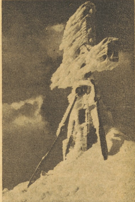
Križ na Velikem Kleku (Glocknerkreuz) (3797 m)

Razlagalci razumejo pod tedni letne tedne, to je sedem let. Od odloka, da se znova pozida Jeruzalem, leta 445 pr. Kr. je preteklo 49 let, da so ga v res- nici pozidali, kar znaša 7 letnih tednov. In potem je preteklo 62 letnih tednov, to je 434 let do Kristusovega krsta v Jordanu. V polovici 70 tedna pa je bil umorjen in s svojo odrešilno smrtjo začel novo zavezo.