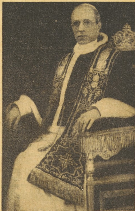
Razglasitelj dogme o vnebovzetju Device Marije papež Pij XII.

Vsa vas je postala eno samo jadvokovanje. Ženske so z raztrganimi krili kakor nore iskale skrivališč. Moški so v zadnjih vzdihih ležali v lastni krvi po dvoriščih. Vojaki so z živalsko podivjanosti vlačili mlada dekleta za