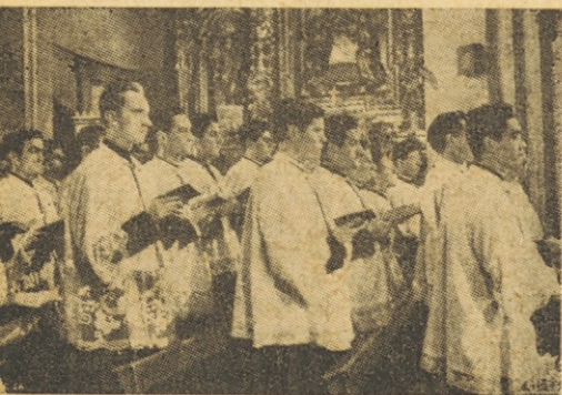
Balarrasa kot bogoslovec

Zadnja leta nas španski film večkrat prijetno preseneča in daje upanje, da „sedma umetnost“ more in tudi mora služiti višjim idealom. K temu pa mo-