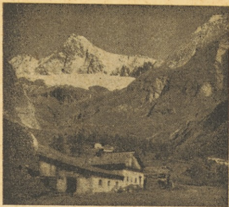
Pogled na Grossglockner s Ködnitztal (od Kalške strani) 3797 m

Tvoj oče gori! Tvoja mati, tvoj brat, tvoja sestra, tvoja žena, tvoji otroci gorijo v ognju v vicah.“ Nato je gospod Simon z očmi premeril cerkev počez in po dolgem: in zmagoslavno nadaljeval: