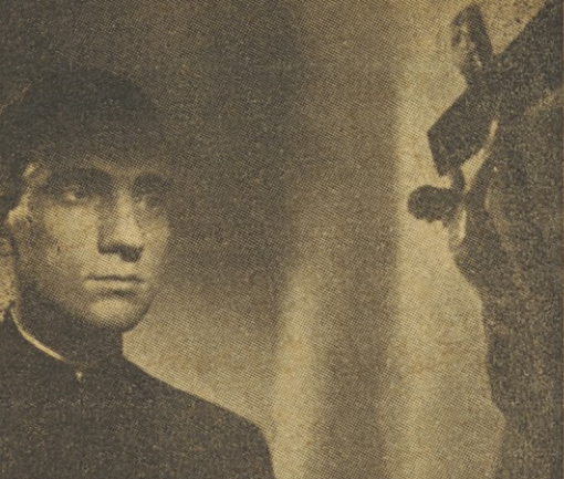
Fernando Fernán-Gómez v „Balarrasi“