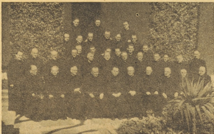
Slovenski duhovniki, zbrani na II. študijskem dnevu dne 26. avgusta 1953 v Buenos Airesu v Argentini

in z vso slavno zapuščino nekdanjega kirasirja. Še danes se sprašujem, kako je mogel zbrati tolik napor volje in kje najti toliko življenjske sile, da se je spravil na noge in zamogel tako okomatati Dejstvo je le, da je stal zravnin tam za balkansko ograjo in se čudil, zakaj so avenije tako prazne, tako neme, polknice povsod zaprte, ves Pariz tako čudno tuj kot velika pristaniška karantena, povsod zastave, toda tako nenavadne, vse bele z rdečimi križi in nikjer ni bilo nikogar, ki bi hitel našim četam naproti.