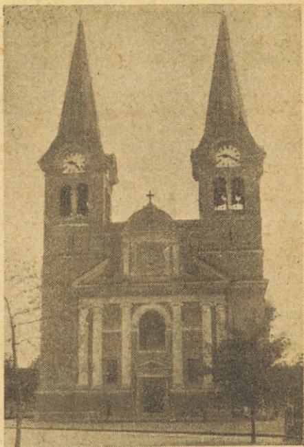
Cerkev Marijinega Vnebovzetja v D. M. v Polju

Kot nezmotljiv verski nauk pa razglasha sveta Cerkev resnico, da moremo vernim dušam uspešno pomagati zlasti mi, ki živimo na zemlji in imamo obilno možnost zaslužnja in zadoščevanja. Trojna je pomoč, ki jo lahko nudimo našim rajnim v njihovi stiski: molitev, mišočina in žrtev. Nad vsem tem pa je daritev svete maše, katere zadostilne in