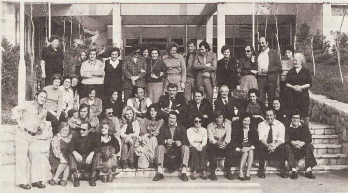
Udeleženci sindikalnega izleta na Plitvice in v Selce pred hotelom Varaždin – tik pred odhodom proti Ljubljani

Medtem ko je bila sobota še precej deževna, pa nas je v nedeljo prebudilo lepo sončno vreme, žal pa smo se morali kopati le v zimskem bazenu z nekoliko pretoplo vodo. V večernih urah smo se utrujeni, toda zadovoljni, vrnili v Ljubljano, upamo pa, da bomo tudi prihodnje leto imeli možnost obiskati kakšen naš domači kraj.