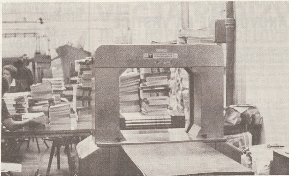
„Nagajivi“ vezalni stroj v ekspeditu