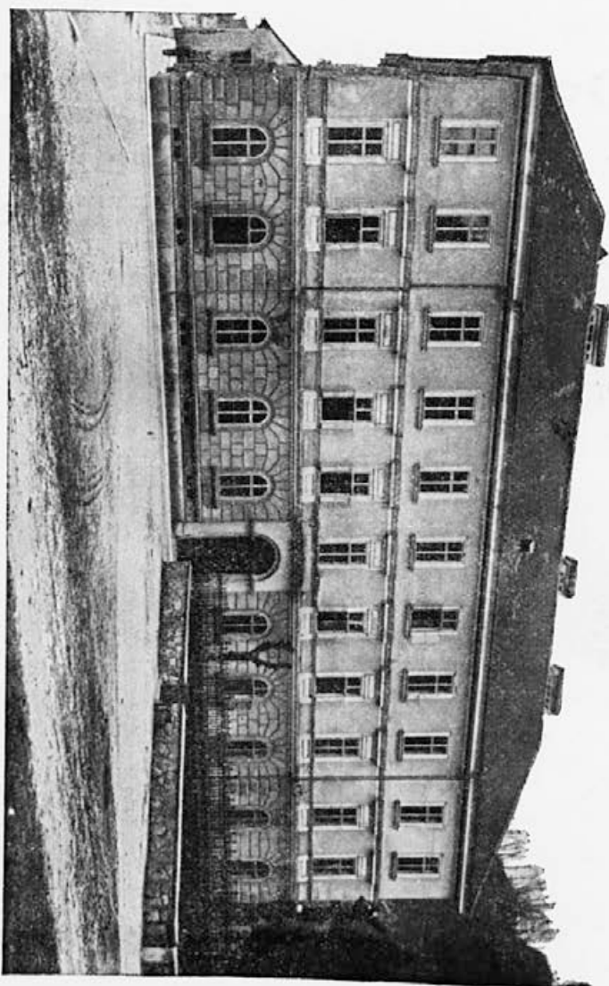
ZGRADBA DRŽAVNE MEŠČANSKE ŠOLE MARTINA HOČEVARJA V KRŠKEM.