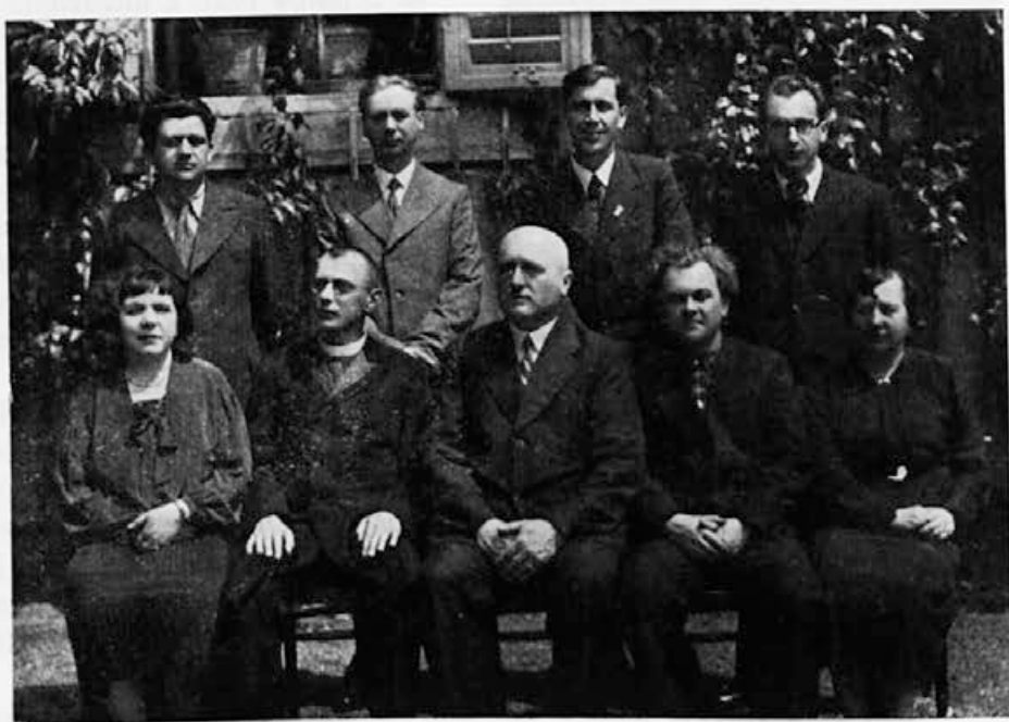
NASTAVNIŠKI ZBOR V JUBILEJNEM ŠOLSLEM LETU 1936.-37.

Omeniti je tudi treba smrt treh žena, katerih imena so tesno povezana z imenom meščanske šole, ki so bile svojim možem neutrudljive pomočnice ter v predvojni dobi vnete sodelavke pri dijaški kuhinji, in