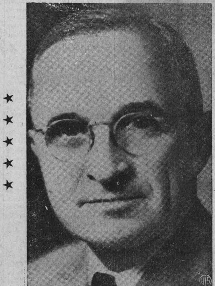
HARRY S. TRUMAN novi predsednik Zed. držav