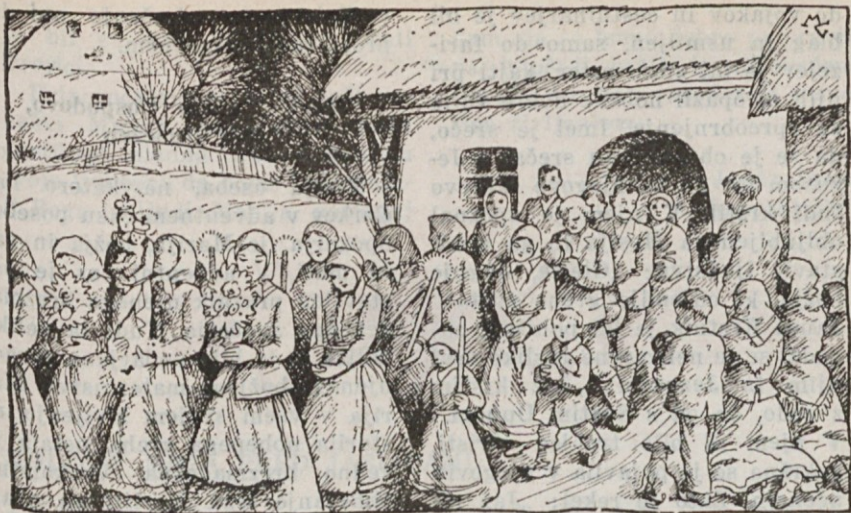
V adventnem času „nosijo Marijo“ (Maksim Gaspari)

ventu posebej pogosto srečujemo, je Janez Krstnik, Kristusov predhodnik. Sveto pismo hvali že njegove starše, očeta, duhovnika Zaharijo, in mater Elizabeto, ki je bila Marijina sorodnica. Ob njegovem prihodu na svet so se godile čudežne reči, da so se ljudje po pravici vpraševali: „Kaj neki bo iz tega otroka? Gospodova roka je bila namreč z njim“ (Lk 1, 66). Iz njegovih otroških in deških let nam ni nič znanega. Nedvomno so ga svetniški starši vzorno vzgajali, pa tudi Bog, ki ga je določil za vzvišeno nalogo Odrešenikovega predhodnika, ga je usmerjal kvišku. V primerni življenjski dobi je odšel v puščavo. Ni nam znano, če se je pridružil kakšni esenski skupini in se je v družbi teh puščavnikov