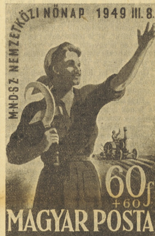
Za mednarodni dan žen so na Madžarskem prvič v zgodovini izdali poštne znamke, označene s kladivom in srpom