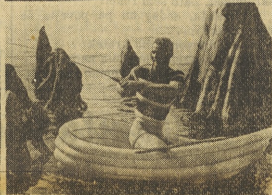
„Vinylife“ je umetni material, iz katerega izdelujejo na Angleškem nove, posebno trdne in odporne čolne, katere napolnijo z zrakom kot nogometno žogo. Cena teh čolnov je nižja od cen navadnih čolnov. Levo zgoraj vidimo čoln, ki je 140 cm dolg, tehta 1 kg in prenaša težo dveh otrok in ene osebe do 16. leta. Pri tem čolnu lahko roke nadomestijo vesla. Večji čoln (desno zgoraj in levo in desno spodaj) tehta napolnjen z zrakom samo 21½ kg. V njem je možno prevažati dve odrasli osebi in dva otroka