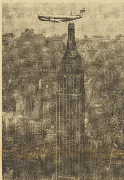
Novo veliko letalo, imenovano „Leteči oblak“, z 71 potniki, nad najvišjim nebotačnikom New Yorka, pred svojim prvim poletom preko Atlantika