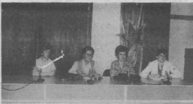
Delovno predsedstvo ustanovnega društva ljubiteljev ročnih del