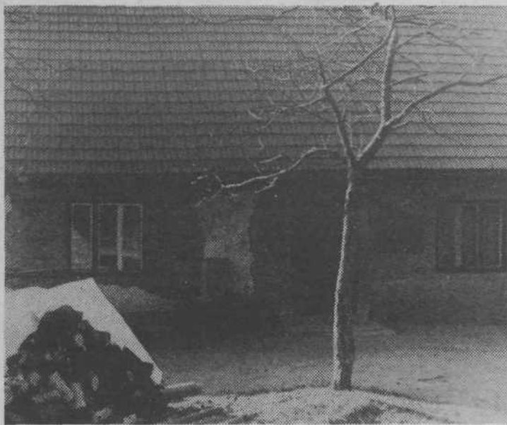
Maroltova domačija. Še se poznajo sledovi plamenov na zidovju.