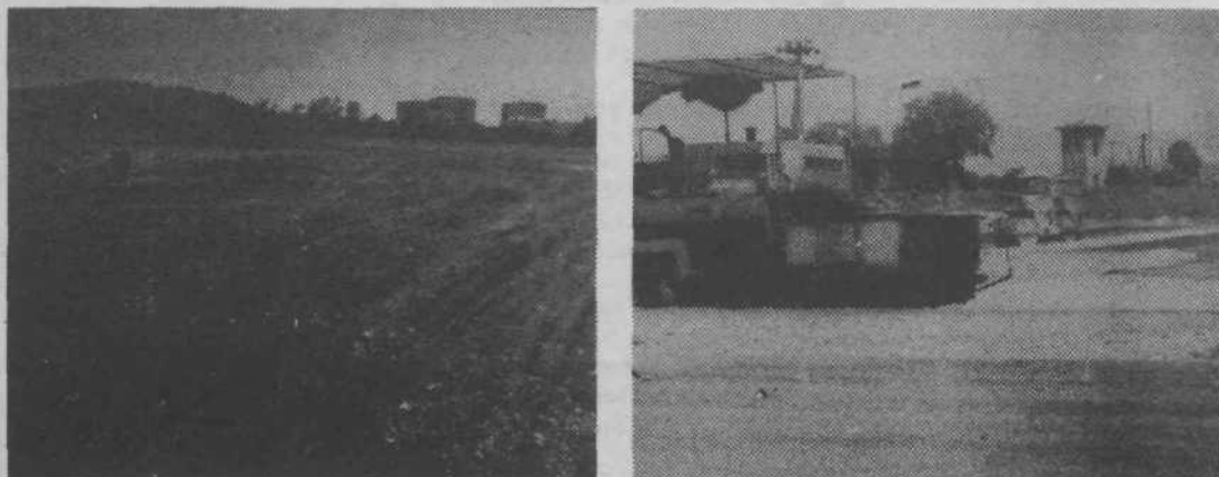
Dve leti je čakalo fužinsko gradbišče