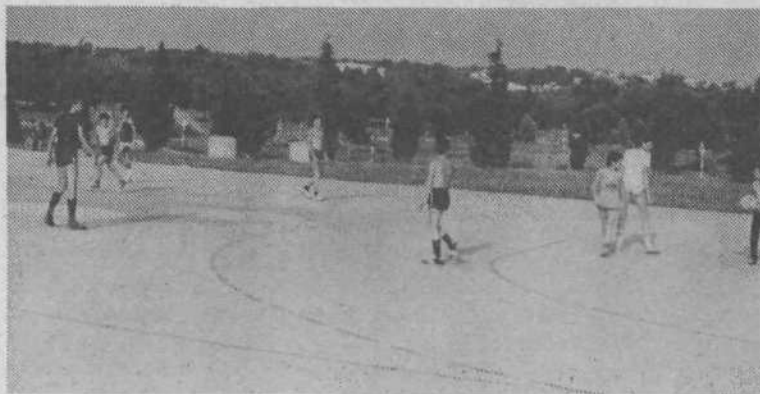
Najmlajši so se pomerili v nogometu, pri katerem ni manjkalo niti zadetkov niti dobre volje.

Ljubljanska območna košarkarska zveza je pripravila za učenke in učence osnovnih šol iz Ljubljane, ki so vadili v okviru šolskih športnih društev v prvih in drugih košarkarskih selekcijah, aktivno letovanje v jugoslovanskem rekreacijskem centru v Puntičeli pri Pulju. Mladi košarkarji, največ jih je bilo prav iz osnovnih šol v občini Ljubljana Center, so imeli dvakrat dnevno trening košarke, odigrali so tudi več tekem, ostali čas pa so posvetili plavanju ter drugim športnim panogam, med katerimi so še najraje igrali nogomet in rokomet. Mladi košarkarji in košarkarice, med katerimi je veliko