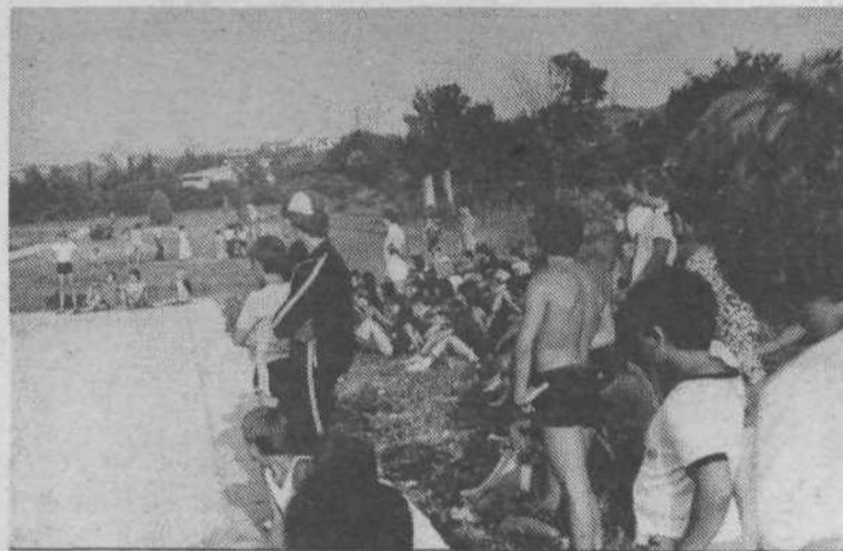
Med tekmo seveda ni manjkalo navdušenih navijačev, ki so s ploskanjem pozdravili vsak zadetek domačih košarkaric.