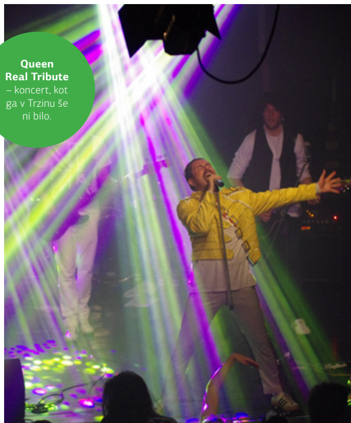
Queen Real Tribute – koncert, kot ga v Trzinu še ni bilo.