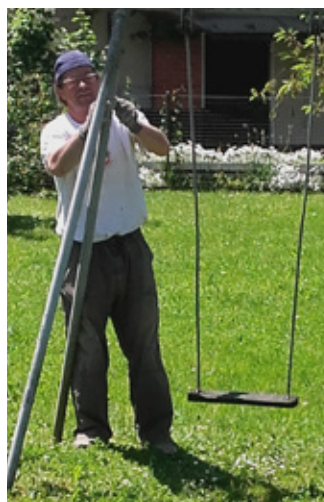
Na igrišču na Reboljevi ulici so pobrusili in pobarvali gugalnico.