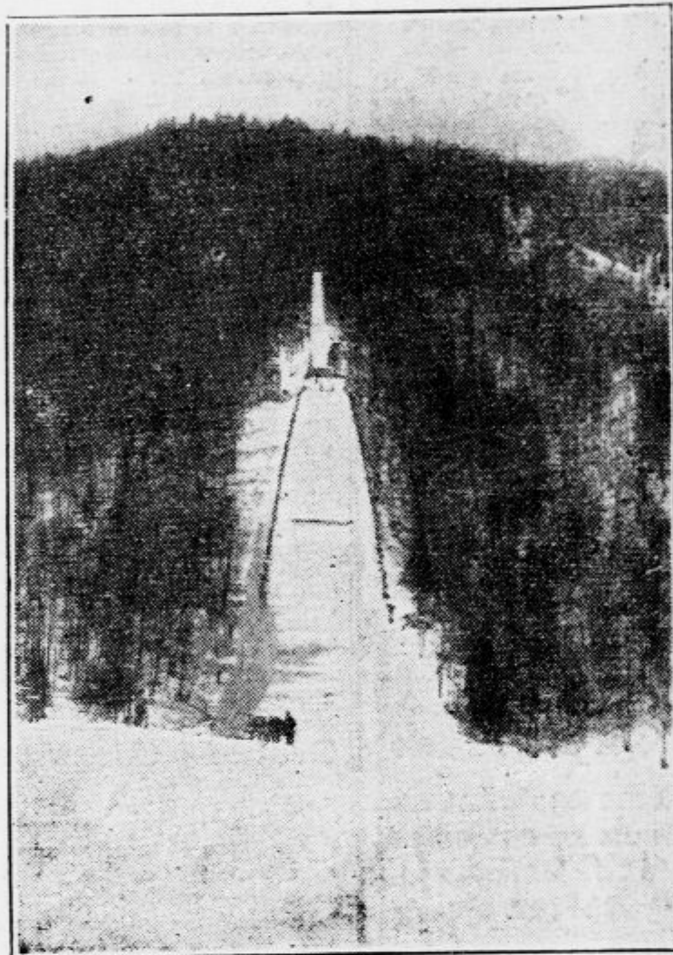
Pogled na novo urejeno skakalnico, kjer je bilo včeraj izvedenih okoli 60 skokov — z redkimi izjemami brez padcev.

kar je bila obenem garancija, da bodo letošnji rezultati prav gotovo prekosili lanske in se približali fenomenalni stometerski znamki. Ta nada je bila tem bolj upravičena, ker so treningi na skakalnici iz dneva v dan kazali lepše rezultate in se je Andersen prav na zadnji dan treninga pognal na 99 m.