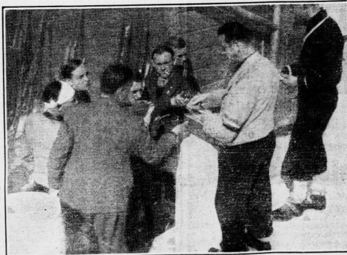
Tekmovalci so kakor otroci, kadar jih obdarujejo z bomboni. Funkcionar JZSS deli tekmovalcem bonbone proti prehladu.