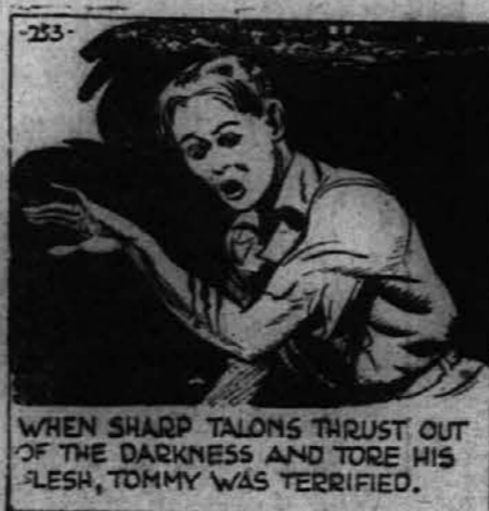
WHEN SHARP TALONS THRUST OUT OF THE DARKNESS AND TORE HIS FLESH, TOMMY WAS TERRIFIED.