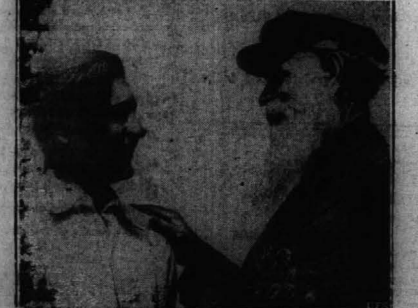
Gornja slika je bila poslana iz Moskve in kaže nekoga starca, bivšega vojaka črnske Rusije, in njegovega vnuka, katerega sta se zdaj oba prstočno prijavila med ljudske obrambne sile v Moskvi.

SV. CEZARILJO , nadškof angleški (l. 542) je prerokoval: