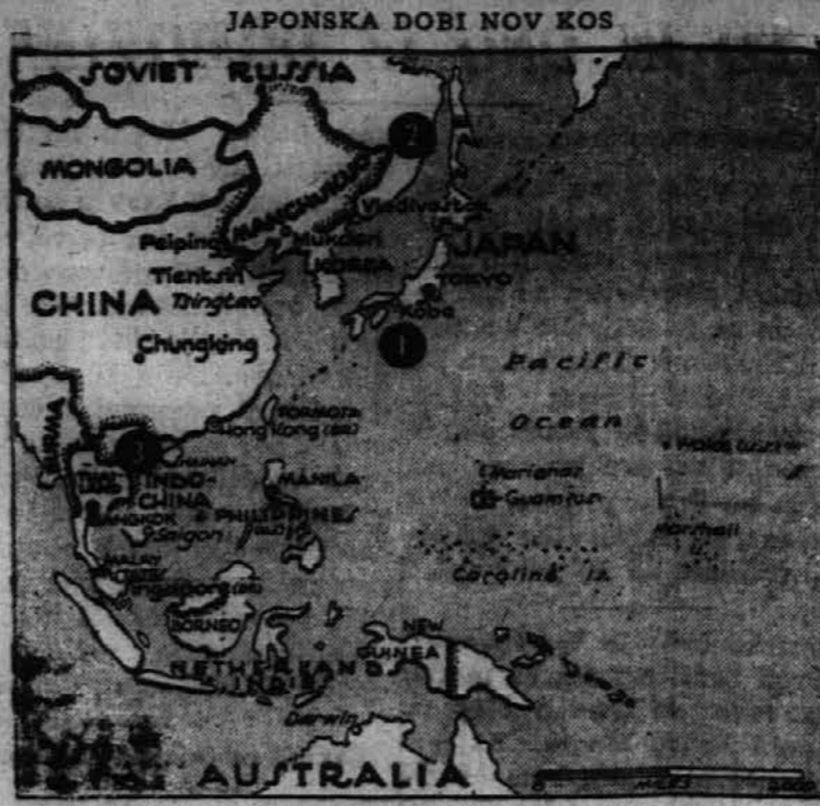
Zemljevid Orienta, ki kaže Japonsko (1), obenem pa tudi francosko Indokitajsko (3), kjer bo Francija prepustila Japonski nova oporiča.

Bodi prepričan, da v tebi še ni pravega duha, dokler ne bitiš tudi tebi po volji. Farizeji se nestrpljivo terjali od Zveličarja, da obsodi prešestnico. Postali so pa drugih misli, ko jih je Krist opominjal lastnih hudobij. "Kdor je izmed vas