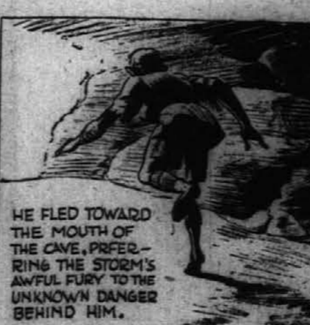
HE FLED TOWARD THE MOUTH OF THE CAVE, PREFERING THE STORM'S AWFUL FURY TO THE UNKNOWN DANGER BEHIND HIM.