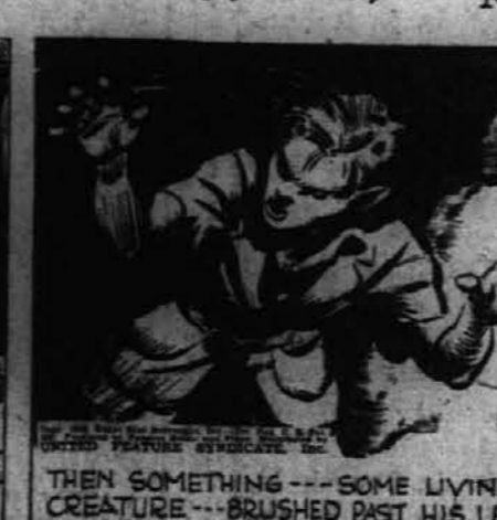
THEN SOMETHING --- SOME LIVING CREATURE --- BRUSHED PAST HIS LEGS.