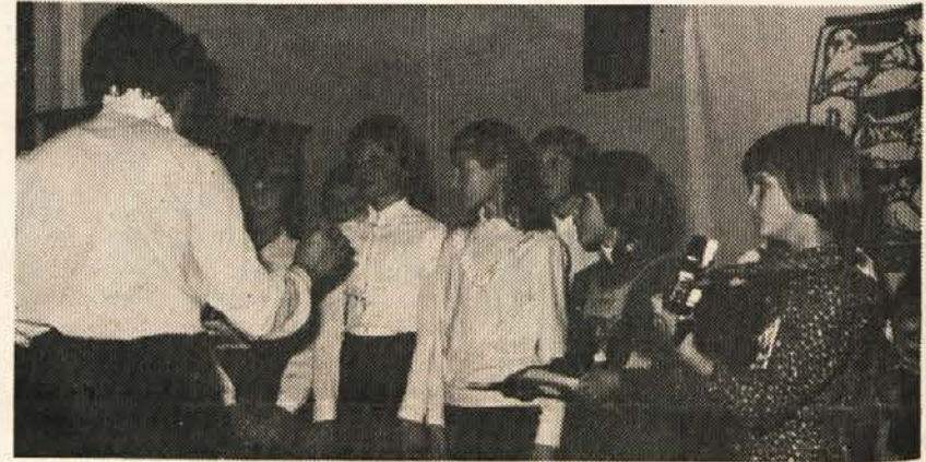
Zelo močno so bili zastopani Šentjanžščani

nost, iz različnih področij prosvetne dejavnosti, pokazati kaj ve in zna.