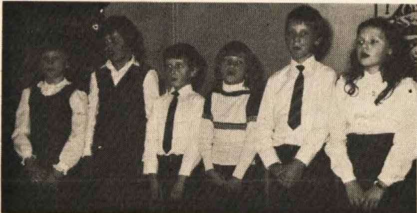
Plajberški mladni pevci

in Slovenjim Plajberkom. Tudi mesto Borovlje, v osrčju tega območja, je bilo močno zastopano. Skratka mladina spodnjega Roža je bila v nedeljo zbrana v Šmarjeti, da se pred-