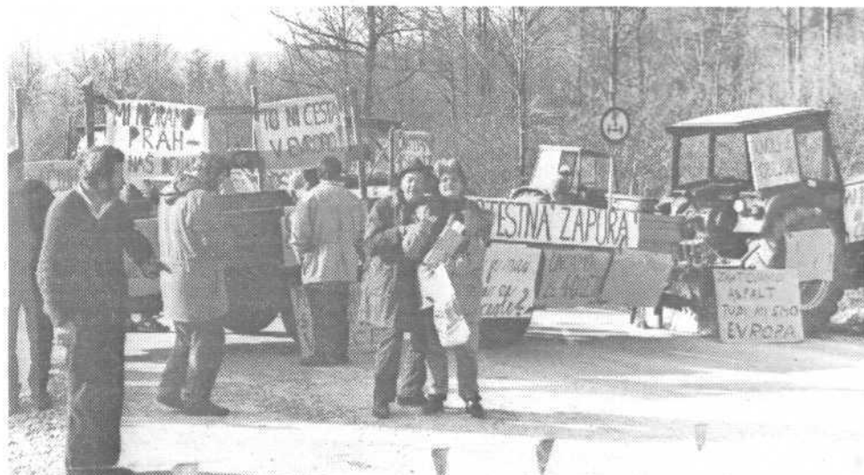
K cestni zapor ni bilo predstavnikov občinskih, mestnih in republiških cestnih oblasti. Kaj bodo morali Rakičani še storiti, da bodo dobili obljubljenih 7 kilometrov asfalta do Preserja?