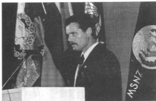
Glavni zbor ZVVS 17.05.1996, kulturni dom Španskih borcev.

Spoštovane veteranke in veterani! Iskrene čestitke ob 5. OBLETNICI VOJNE ZA SAMOSTOJNO SLOVENIJO.