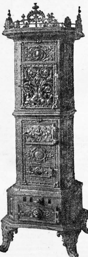
Salonska peć za ugljen.

Poštanska i željeznička stanica: Vareš — Majdan