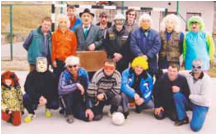
Poveselili smo se in nasmejali.

Lepo vreme nam je narekovalo in omogočilo, da smo tudi letos uspešno izpeljali vsa pustna dogajanja, se poveselili in prispevali svoj delež k ohranjanju starih pustnih navad. Zagotovo pa lahko zatrdim, da je tokrat zapozneli pust zanesljivo pregnal zimo in naznanil novo lepo pomlad.