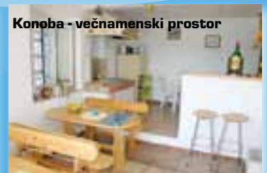
Konoba - večnamenski prostor