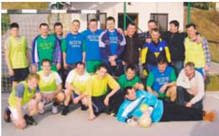
Druženje ekip mora biti tudi v bodoče.

Ob prijetnem zaključku smo bili vsi mnenja, da se tudi v bodoče nadaljujejo takšna nogometna srečanja.