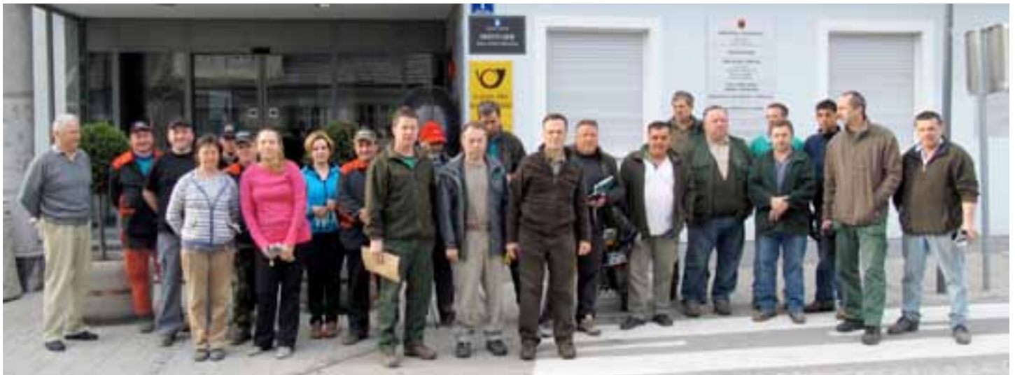
Zbrani udeleženci čistilne akcije v Lukovici.