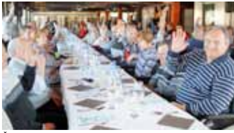
Člani so z glasovanjem sprejeli in potrdili programe.