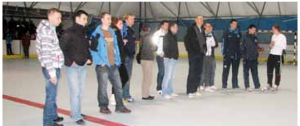
Možje zmagovalnih ekip.