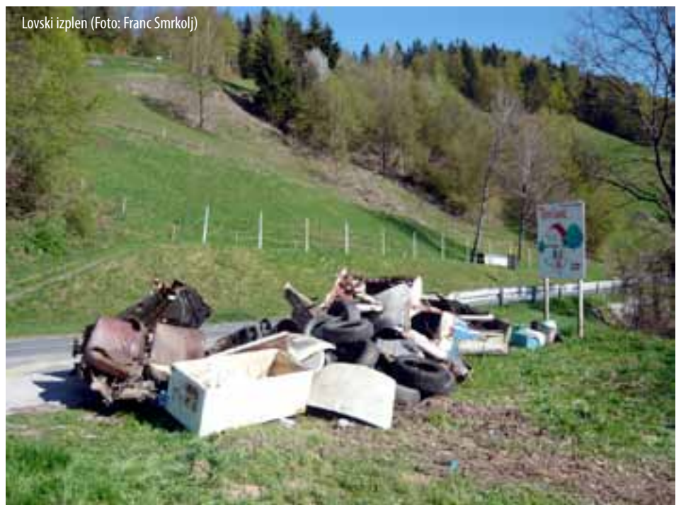
Lovski izplen

Nesnaga na fotografiji je ležala v globeli za avtobusno postajo na vrhu Učaka, nekdo očitno meni, da je tam smetišče. Lovci, ki se veliko gibajo v naravi, še vedno opažajo, da ljudje kljub vseslovenskim čistilnim akcijam, mnogim opozarjanjem in grožnjam inšpektorjev še vedno pred svojim pragom radi počistijo tako, da zmečejo nesnago na nek drug prag. Velikokrat sicer nesnago skrijejo pred očmi ljudi, saj jo odvržejo kam, kjer človeška noga ne hodi pogosto, a s tem grobo posežejo v naravni habitat živali. Priložena fotografija naj bo v opomin in v sramoto vsem tistim, ki še vedno mislijo, da je narava veliko smetišče.