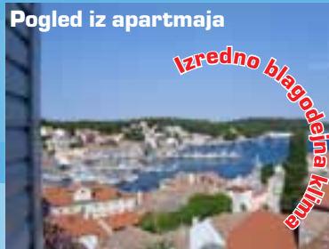
Pogled iz apartmaja