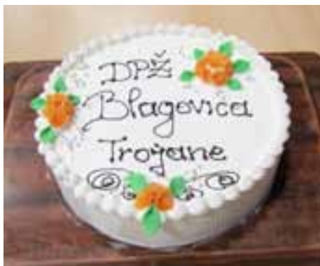
Tako je videti torta, ki jo oblikujejo večše roke