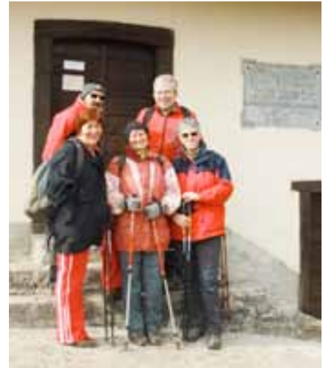
Udeleženci ŠTD pred Jurčičevo hišo

V prijetnem vzdušju smo mislili na naše ustvarjalce, si zadali nalogo, da še enkrat preberemo Rokovnjače, in z veseljem se bomo še kdaj vrnili na to zanimivo pot.