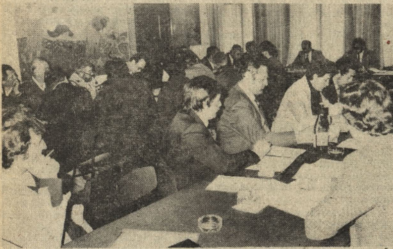
Delegati delavskega sveta pozorno spremljajo razpravo

Po razpravi so bili sprejeti naslednji pomembnejši sklepi in sicer: