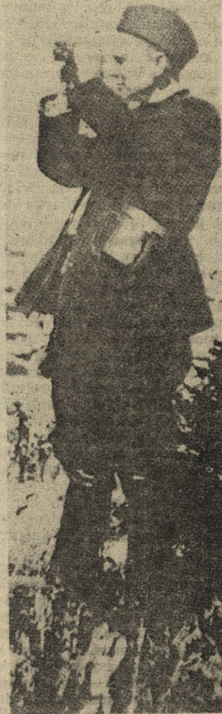
Tito — pogled v prihodnost

Francoski politik Pierre Mendes-France (1955)