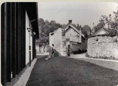
1975 ~ 2010 | Pot na Poljane po izgradnji kegljišča na delu Frančiškanskega vrta, pogled proti Poljanam.