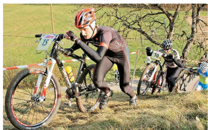
Krožna proga vsebuje naravne in umetne prepreke, zato mora kolesar del proge prehoditi oziroma preteči ob kolesu.