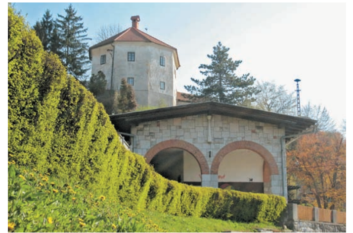
Osmerokotni Kljubovalni stolp, današnja Rautarjeva graščina na Žalskem hribu nad železniško postajo.