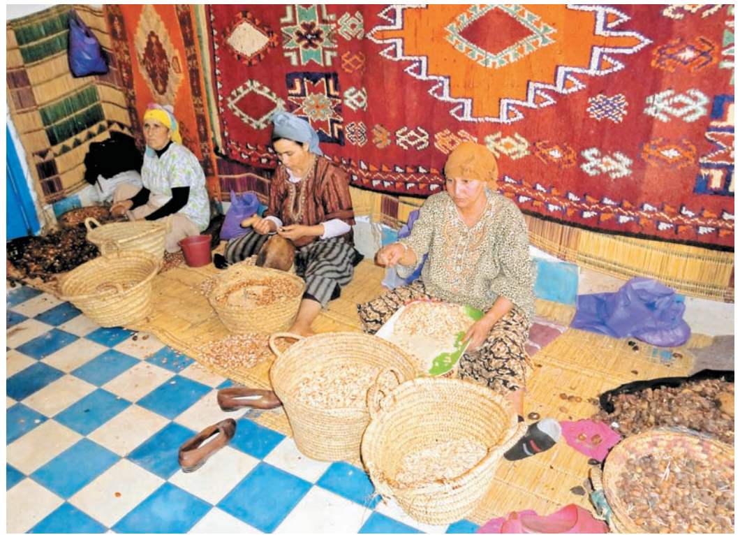
Pridne roke v ženski zadrugi iz plodov arganovih dreves pridobivajo dragoceno arganovo olje.