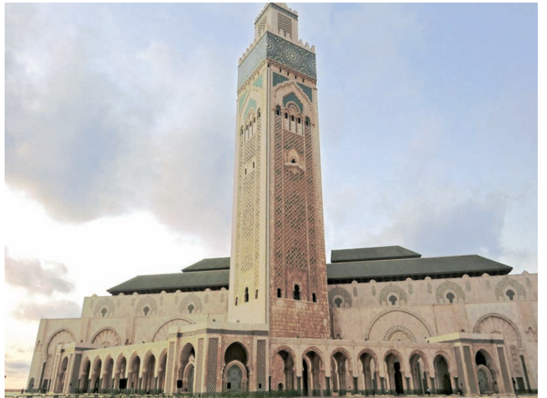
Mošeja Hasana II. v Casablanci z najvišjim minaretom na svetu, na vrhu je laser, ki vernike usmerja proti Meki.