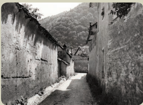
1969 ~ 2010 | Pot na Poljane – pogled proti mestu; na desni strani posnetka iz leta 1969 se vidi obzidje vrta Frančiškanskega samostana, ki je bilo nato odstranjeno.

DRUGEga NOVEMBRA LETOS JE MINILO 46 LET, ODKAR JE BILA OBJAVLJENA PRVA ODLOČBA O ZAVAROVANJU SPOMENIKOV IN ZNAMENITOSTI KAMNIKA, 7. NOVEMBRA PA 25 LET OD OBJAVE VELJAVNEGA ODLOKA O ZAVAROVANJU KAMNIKA ZA KULTURNI IN ZGODOVINSKI SPOMENIK. GLEDE NA IZKUŠNJE SO BOLJ OD ZAVAROVANJ POMEMBNE VSEBINE, KI DEDIŠČINI VRAČAJO ŽIVLJENJE. JIH BOMO ZA KAMNIK NAŠLI PRAVOČASNO?