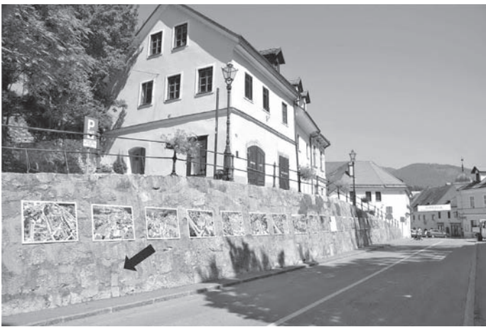
Pri gradnji Samčevega predora skozi nekdanji strmi Klanec so leta 1882 našli skrivni podzemni rov (puščica).