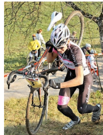
Na strmih vzponih je potrebno kolo oprtati na ramo.