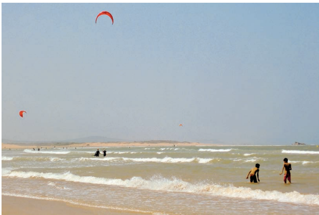
Peščena plaža Essaouire – močan veter nas je odvrnil od kopanja, zato pa so toliko bolj uživali surfarji in kajtarji.