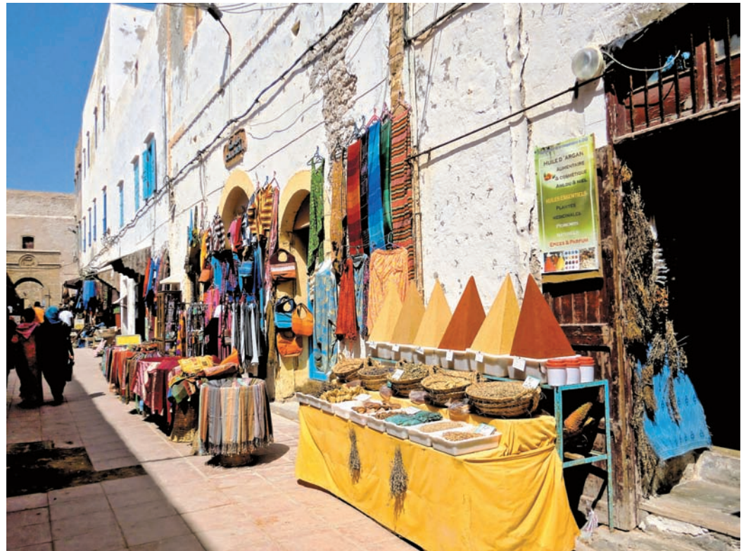
Pisana tržnica v Essaouiri – le kako jim uspe, da se piramide iz začimb ne podrejo ...