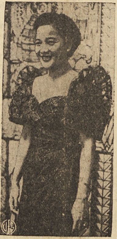
FILIPINSKA PRVA GOSPA — Luz Banzon Magsaysay, soproga filipinskega predsednika, je vneta in dobra gospodinja. Ves svoj čas porabi za vzgojo svojih otrok in v brigi za red v Malacang, tamkajšnji "Beli hiši."

Razpravljalo se bo o vidikih in stališjih delavcev in delodajalcev. Tekom te konference si bodo redovnice ogledale tudi razne clevelandske industrije.