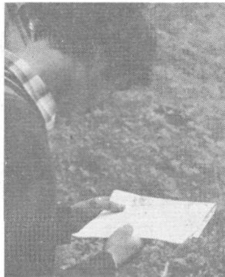
Kam sedaj? Karta tudi vedno ne pove vsega in znajti se moraš sam.

VETERINARSKI ZAVOD KRIM GROSUPLJE DE LJUBLJANA VIČ-RUDNIK ŠTEVILKA DEŽURNE SLUŽBE TEL. 268-543 – neprekinjeno 24 ur ŠTEVILKA SLUŽBE OSEMENJEVANJA GOVEDI TEL. 268-543 (NAROČILA OD 7. DO 8.30)