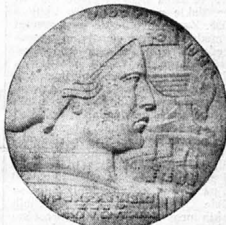
Sletska plaketa (Rad kipara A. Dolinara iz Beograda)

Čitavih 10 nedelja deli nas još od sleta. Pripravljajte se za slet!