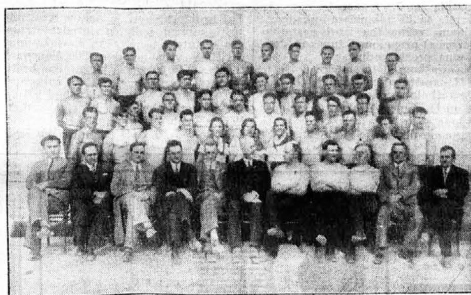
Prednjački tečaj Sok. župe Šibenik-Zadar (2 III do 1 IV 1933)

Tečaj se održavao u vojnom logoru »Sv. Križ« gde je bilo prenoćište i hrana za sve tečajnike. Rad je započeo pod noć u 7 sati, a trajao do 12, posle podne od 14 do 19. Red u citavom logoru, odnosno za onaj deo koji je bio upotrebljen za tečaj, bio je poveren jednom od tečajnika za jedan dan, a sve to nadzirao bi jedan brat — načelstva određen za to.