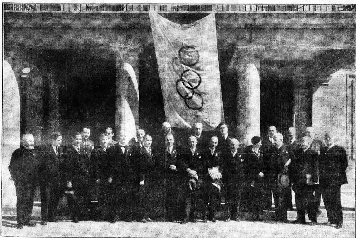
Učesnici skupštine Međunarodnog gimnastičkog saveza, održavane dne 11 i 12 o. m. u Lozani

šiti pitanje žena u Međunarodnom gimnastičkom savezu moraju se najpre pridobiti ženske telovežbačke organizacije, koje u nekim državama rade samostalno, da stupe u Međunarodni gimnastički savez, čija će pravila trebati u tom smislu izmeniti. Do tada se iznimno dozvoljava, da poradi na tome da pridobije ženske vrste za nastup na međunarodnom takmičenju u Budimpešti, koje bi se vršilo pod