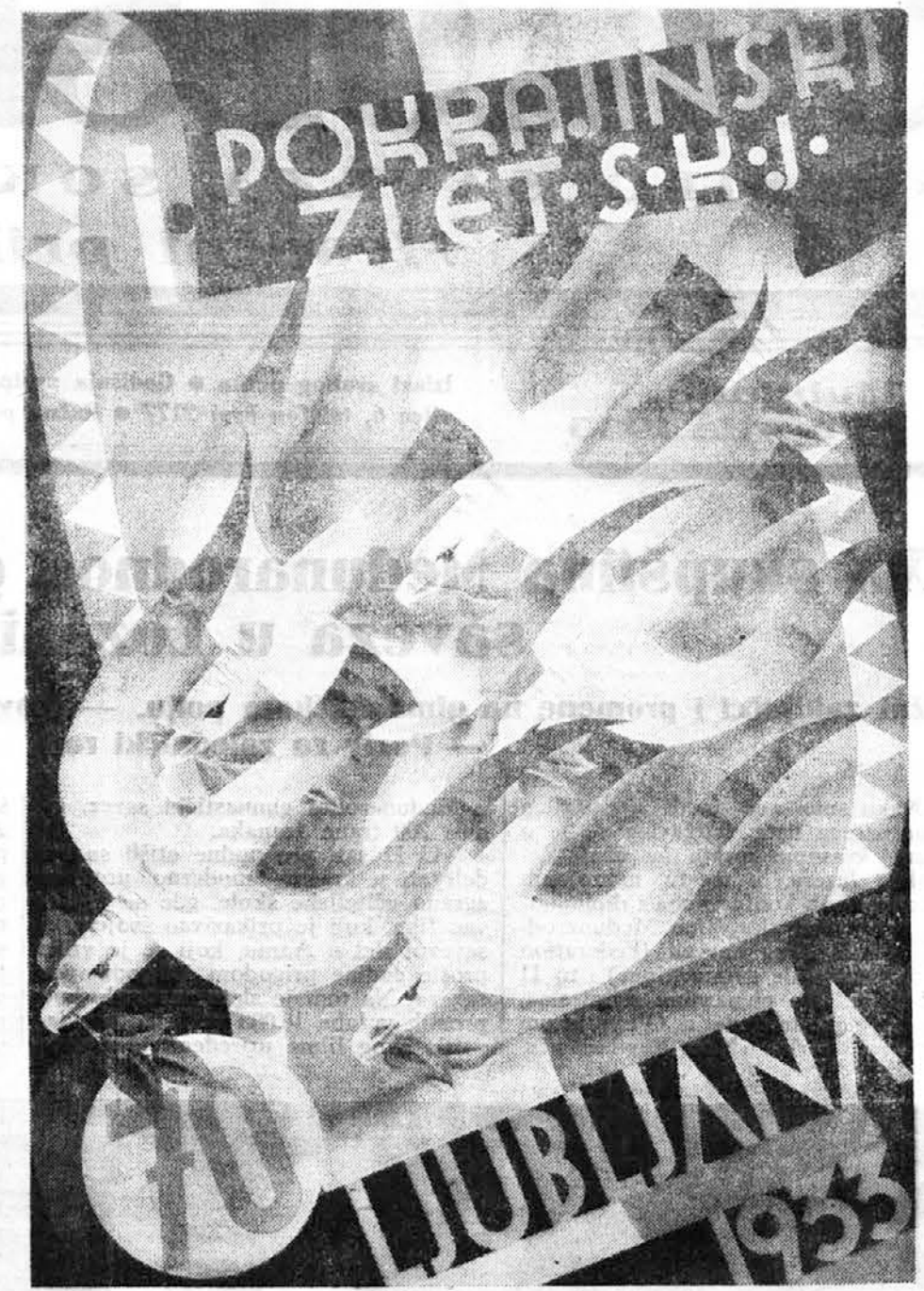
Sletski plakat za pokrajinski slet u Ljubljani (II nagrada — rad inž. arh. D. Sarajnika i grafičara E. Gorjupa iz Ljubljane)

Lužičko srpski Sokol ostavio je u jugoslovenskome Beogradu malo sokolsko gnezdašće, koje ne mogu nikakvim nasiljem neprijatelji Slovenstva uništiti. A u tome gnezdašću di-