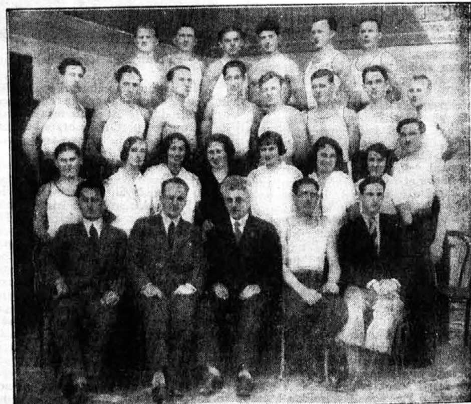
Prednjaćki tećaj Sokolskog okrućja Slav. Brod (13-18 marta 1933)

Braća predavaći su svakoga dana dolazili u vežbaonicu i u nezvanom razgovoru posle obuke produblivali