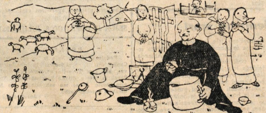
Gospod kaplan je glavice preiskre: »Kaj božji hram! Vrzimo na kozice se in piskre! Postal je »spengler«; cini, v kalnem kuha, po starem meša... Sment: ne bo preuroča juha?!