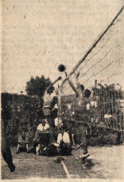
Borba nad mrežo

V letih vojne, ko so zavezniška letala spuščala v okolici Predgrada v Be-