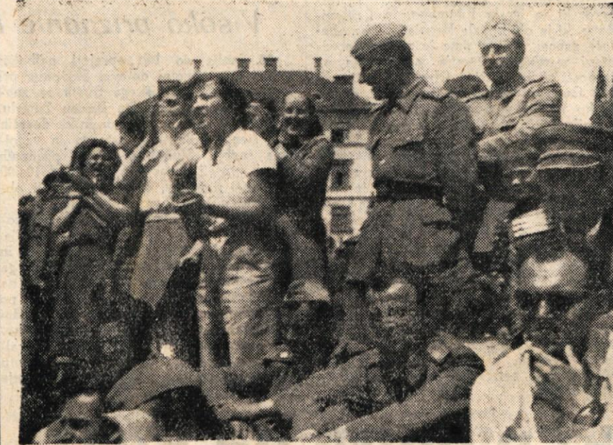
Vzpodbujajoči klici domačih navijalk in navijalcev hrabrijo »Krko« na Loki