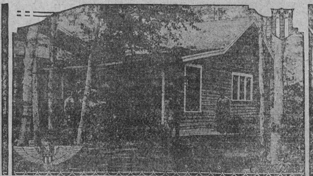
Na sliki vidimo poletno Belo hišo, v kateri stanuje predsednik Coolidge in soproga, ki se nahajata na počitnicah. Taproster se imenuje "White camp," in leži ob Osgood jezeru. Hišo straži oddelek mornarjev.