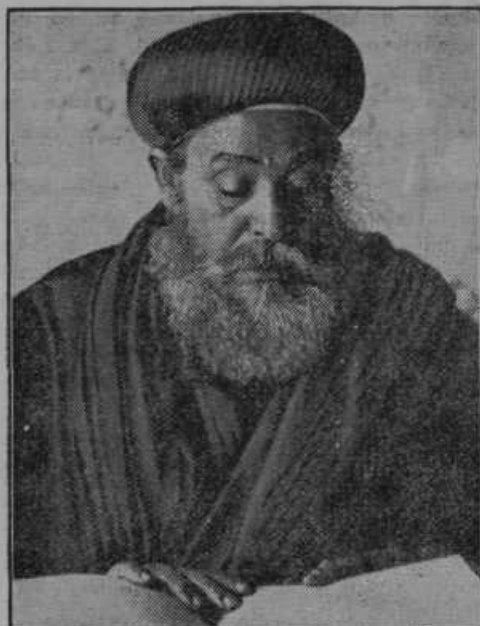
Duhovni poglavar Abesinije proglašaja cesarjev ukaz sveto vojno.

rojstva vajeni Abesinec prehodi brez posebnega truda 70km dnevno. Od živali pride tamkaj v poštev za prenos tovora osel, kateremu ne škoduje pik neke vrste strupenih muh. Po takih ožinah je prevoz težjega topništva izključen. Italijani si bodo utirali in pripravljali pot po globokih dolinah s pomočjo bombnih letal, kojih zadetki so pa na raztreseno abesinsko obrambo dvomljivi.