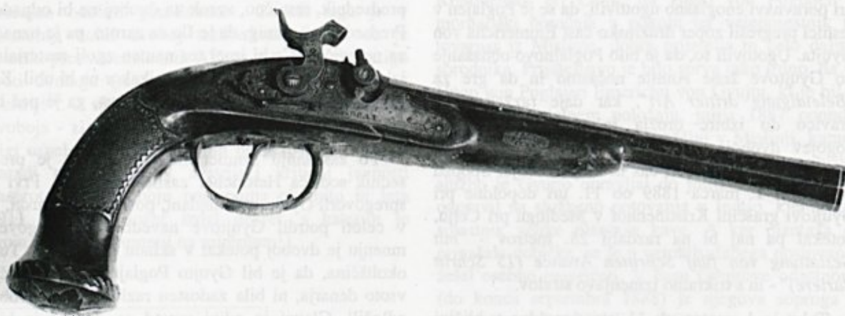
Pištola za dvoboj, druga polovica 19. stol.