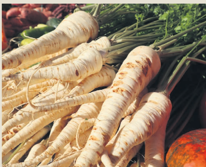
Poškodovane korenovke zamrznemo, posušimo, jih pa ne hranimo v kletih ali zasipnicah.

Zelo pomembno je, da v kletih in zasipnicah hranimo povsem zdrav pridelek, vse poškodovane gomolje in korene raje zamrznite ali kako drugače shranite. Letos je smiselno, da pridelek v kleti večkrat preverimo in preberemo, saj je zelo verjetno, da bo gnitja več.