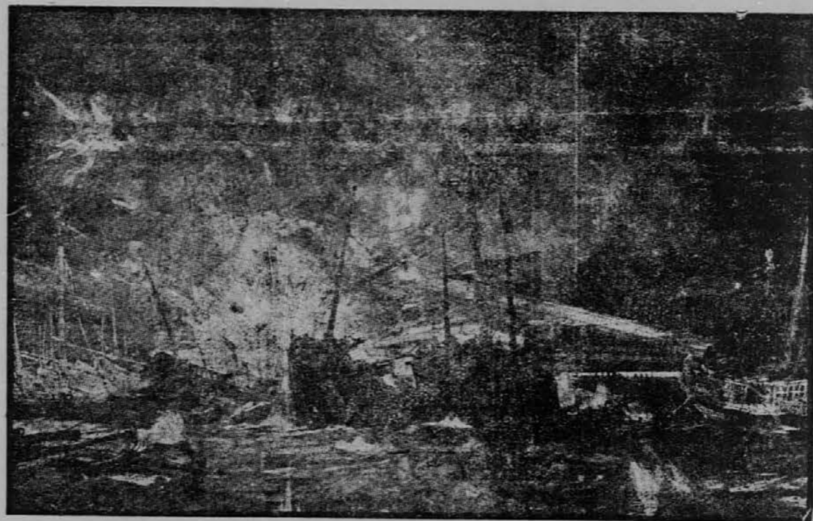
Zaprtje portarthurske luke.

Dallas, Tex., 7. maja. Iz Cisco se brzojavlja, da je v Shakeford coun- tyju razsajal tornado, ob kterej pri- liki so bili v Moranu usmrteno tri osobe. Tudi je vihar razjedal mno- go hiš. Tudi v Aledo je napravil vi- har mnogo škode.