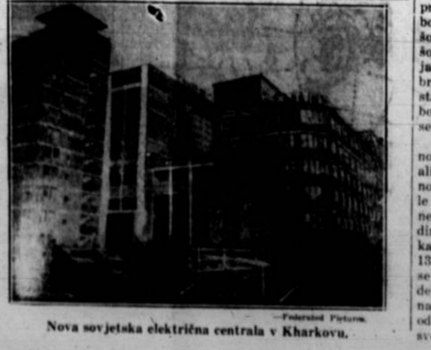
Nova sovjetska električna centrala v Kharokvu.

(Daje iz prve koloni.) trebuje socialno last in socialno kontrolo, če hočemo, da prinese socialno blaginjo človekstvu. (Nadaljevanje čez nekaj dni.)