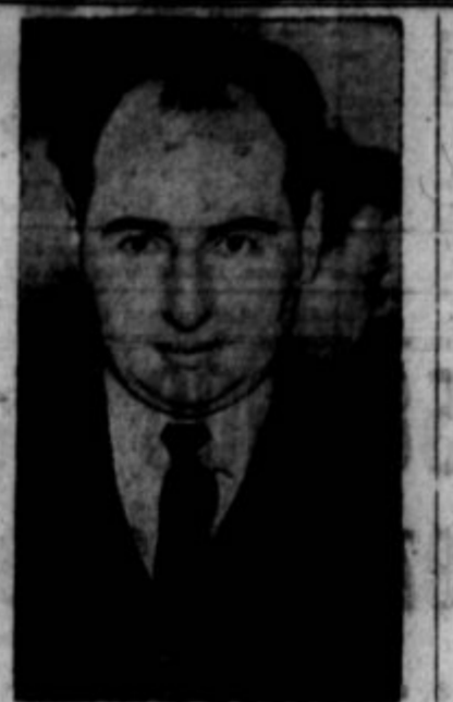
John Strachey, angleški komunist, proti kateremu je vlada opustila izgonsko postopanje.