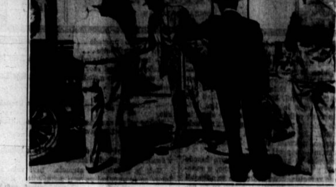
Člani posadke nekega vlačilnega parnika ob zapadnem obrežju, ki so zastavkali za višje mezde.