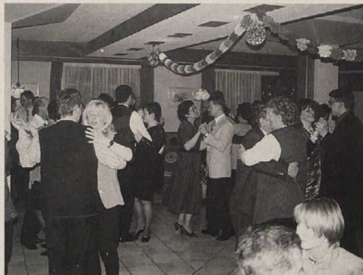
Plesišče na Hodiškem plesu je bilo vedno polno

skoraj brez prestanka. Ples je tudi letos spremljal bogat srečolov, tako da je mnogim povrnil stroške zapitnine in vstopnine.