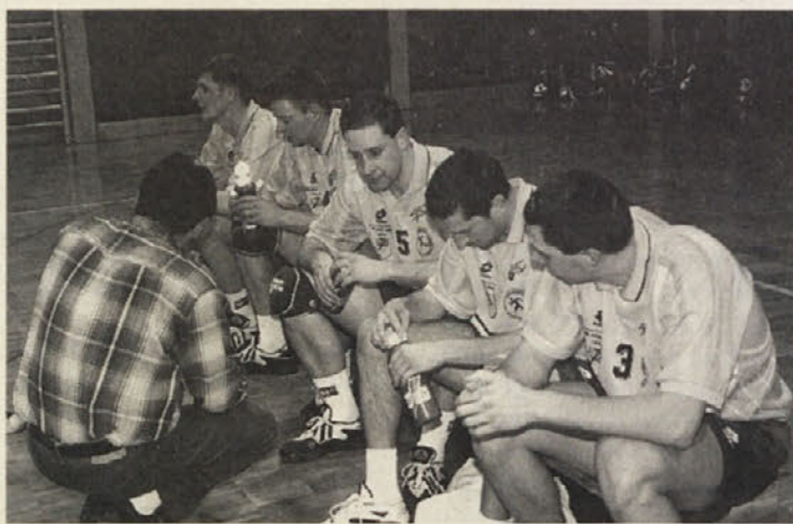
Obrazi povedo vse o trenutni krizi v moštvu