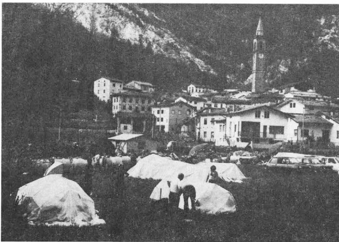
Ter v občini Bardo: ljudje urejajo na travniku pod vasjo zasilne šotore, da bodo vanje spravili iz porušeni hiš rešeno blago

Ob zaključku naj poveljemo, da se je pred tem mudila teden dni v prizadetih krajih tričlanska delegacija jugoslovanskih strokovnjakov, katerih nasveti bodo zelo koristni za obnovo porušeni vasi.