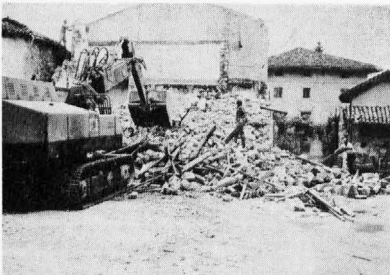
V Dolenjem Barnasu podirajo hiše, ki so ble huduo poškodovane od potresa