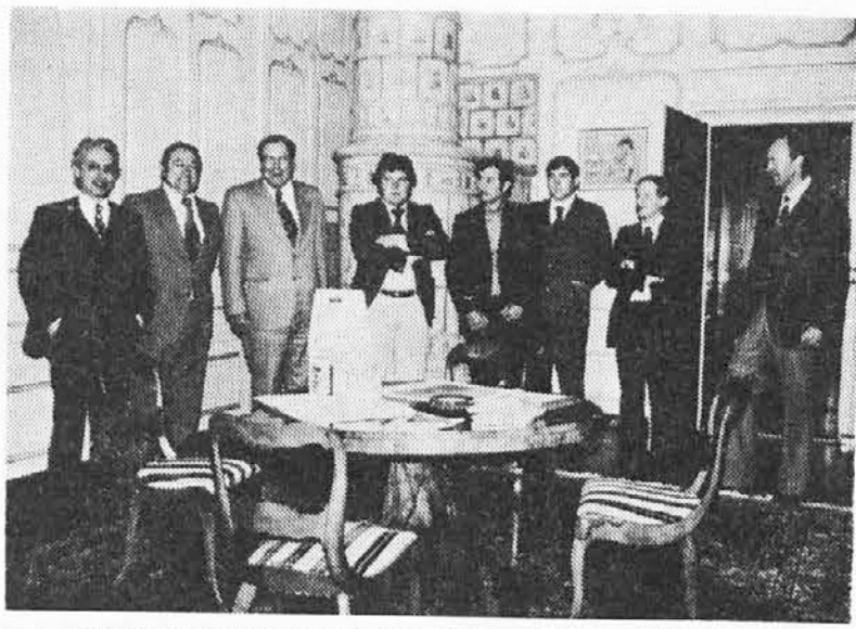
Nasi župani (šindaki) v Švici na sprejemu v sedežu občine Yverdon