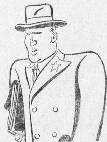
poslanik sovjetske Rusije v Bukarešti