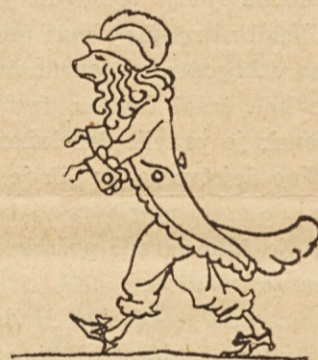
Veličastni pes Koder

“Ta dondek tam,” je nadaljeval dr. Murn Marnjač, “je en patentiran lump...”