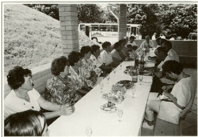
Domačini so na Izletniško turistični kmetiji Lončarič pozorno poslušali predavanje o suhih mesninah.