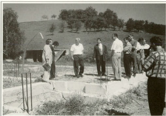
Takoj po podpisu pogodbe je bilo predano gradbišče za novo šolo v Žetalah izvajalcu del.

“V posebno zadovoljstvo mi je, da danes lahko opravi- m to, za kar sem se obvezal v listini, ki smo jo vgradili v temeljni kamen oktobra 1997” je vidno zadovoljen dejal župan ob svečanem podpisu pogodbe z izvajalcem del za gradnjo šole v Žetalah.