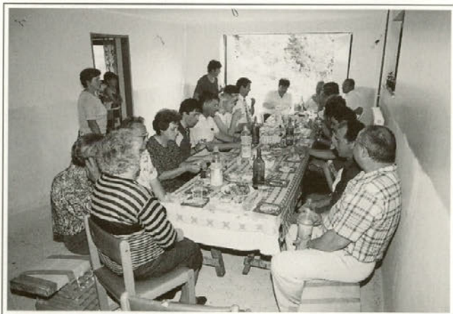
Po otvoritvi novozgrajenega prečrpališča v Preši, so se okrepčali.

V nadaljevanju večera pa je bilo slovesno še v Stogovcih, kjer so odprli še eno zgrajeno vodovodno omrežje. Gre za tako imenovano traso Stogovci-Slape-Doklece, ki je le eden od skupaj 3 delov oziroma krakov celotne investicije, ki zajema primarni vodovod Majšperk-Stogovci-Slape-Doklece-Naraplje. Do otvoritvenega dne je bilo na vseh treh odsekih