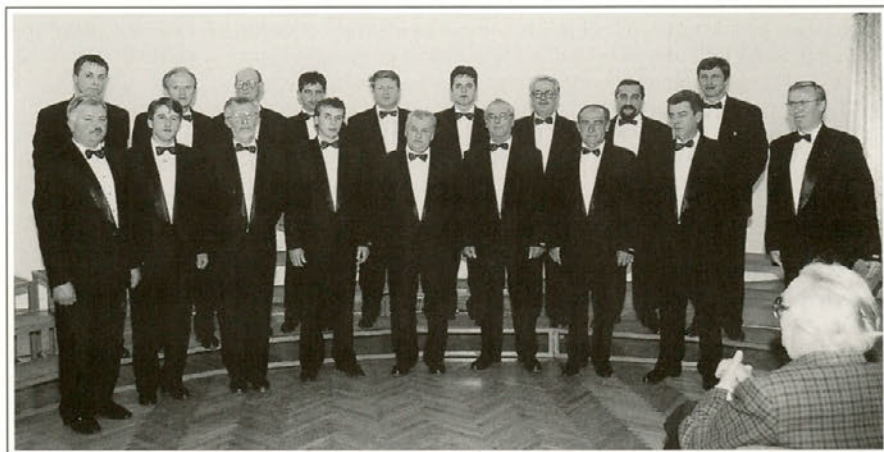
Moški pevski zbor DPD »Svoboda« Majšperk na enem od svojih nastopov.