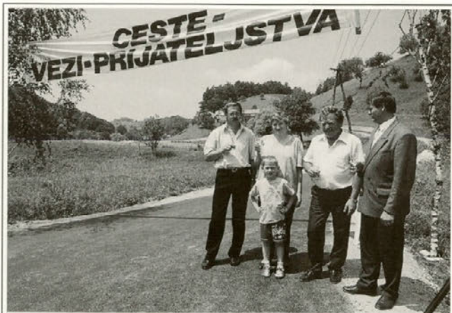
Ceste — vezi — prijateljstva, tako pravijo domačini, ki so na te besede spili kozarček »rujnega«.

Še preden se je v soboto, 27. junija popoldne pričela osrednja občinska slovesnost ob državnem prazniku, je bila dopoldne še krajša svečanost v Žetalah, kjer je odsek krajevne ceste Grabe-Tkavc dobil novo asfaltno prevleko v skupni dolžini 700 m, kar je stalo skupaj 9.064.776 SIT.