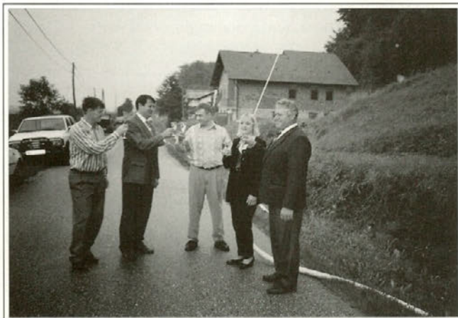
Tako so pomembni pridobitvi neoporečne pitne vode nazdravili v Podložah — z vinom, da ne bo pomote.

liko do celotne vrednosti investicije pa so prispevali krajanje sami, seveda ob pomoči nekaterih donatorjev. Čeprav s težavo in z velikimi odrekami so uspeli zbrati potrebnih 4.126.516 tolarjev, tako da se je investicija lahko pričela in tudi končala v predvidenem roku, za kar je poskrbelo podjetje Tampon d.o.o. iz Podlehnika.