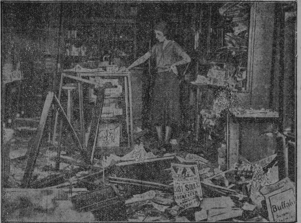
V Ameriki je dovoljeno pivo. Slika nam kaže od tihotapcev razdejano točilnico piva v Clevelandu, ki ni hotela kupovati piva od alkoholnih švercarjev, ki so hudo prizadeti vsled delnega dviga prepovedi alkohola.