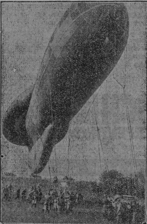
Francoski opazovalni balon, ki se je udeležil letalskih manevrov.

Zopet vlom v Halozah. V Paradižu pri Sv. Barbari v Halozah je bilo v noči 31. maja vlomljeno v zidanico vpok.