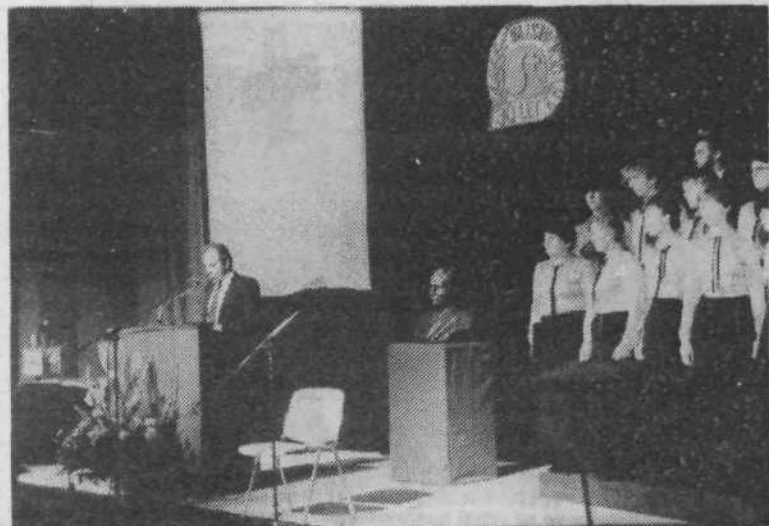
Slavnostna proslava ob obletnici krvodajalstva v domu Ivana Cankarja