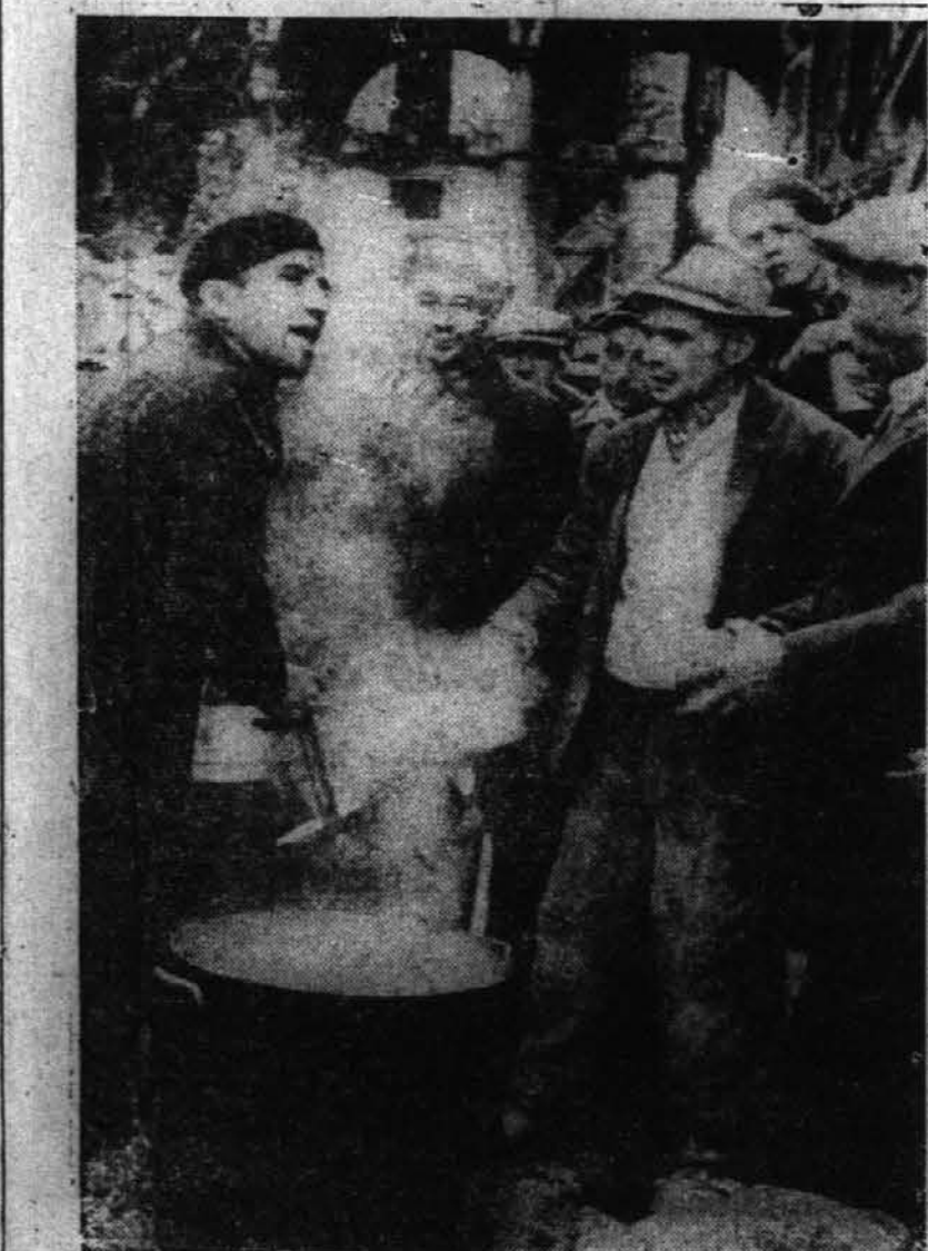
Iz nekih nevtralnih virov je dospela predstoječa slika v Ameriko, ki kaže, kako italijanski delavci, ki morajo delati v takovanih delavskih kuhinjah, prejemajo jed, ko čistijo meste Genoa izpod razvalin od bombardiranja angleških letalcev.