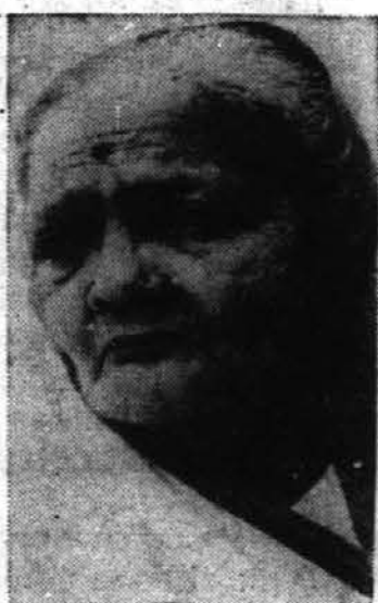
Slika kaže soprogo od indijskega voditelja Mohandasa K. Gandhija, ki je bil pred kratkim oproščen iz internacije. Žena je bila z njim v internaciji in je stara 71 let.