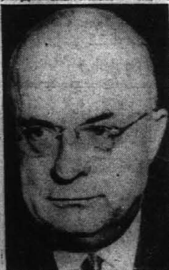
Henry J. Kaiser, ki je imel te dni nekaj sitnosti vsled nabave vojnega materiala brez pooblastil. On zaposluje 200 tisoč delavcev. Pravijo, da gradi po 60 ladij mesečno.