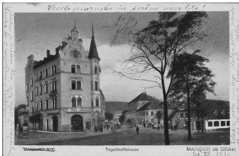
Razglednica Maribora s podobo nekdanje Tegetthoffove ulice – po prevratu je nemški napis »Marburg a. D.« zamenjal napis »Maribor ob Dravi«