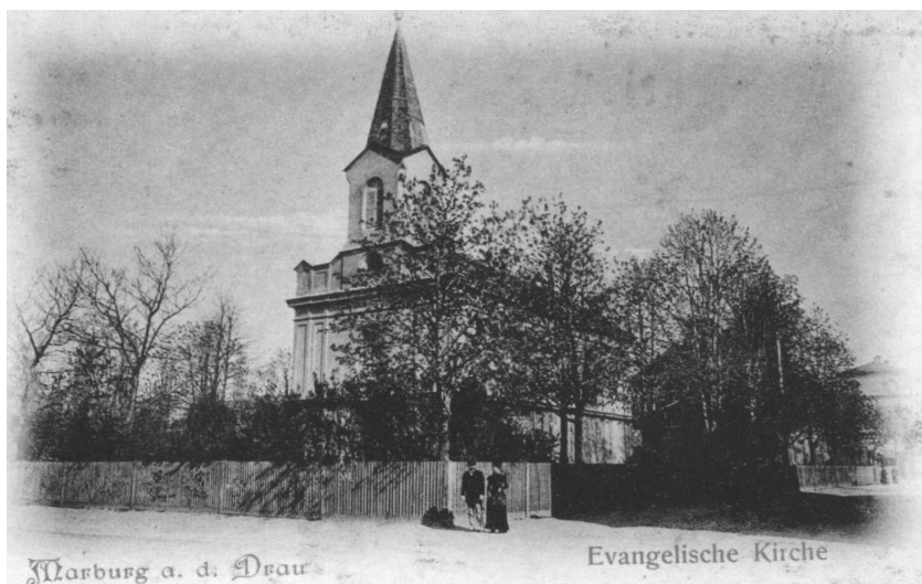
Evangeličanska cerkev v Mariboru na začetku 20. stoletja