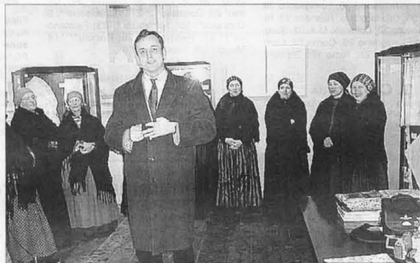
Podpredsednik Pokrajine Carlantoni pozdravlja na otvoritvi razstave na Trbižu

V soboto, 28. februarja se je na Trbižu preselila znana etnografska razstava narodnih noš z naslovom Čarobna nit. Razstavo noš s pasu, ki grte od Milj preko Tržaškega, Goriskega vse tja do Benečije, Rezije in Kanalske doline, je pripravila Tržaška folklorna skupina Stu ledi. Razstava je prepotovala domala vso našo deželo, kjer je najsevernejša postaja prav Trbiž.