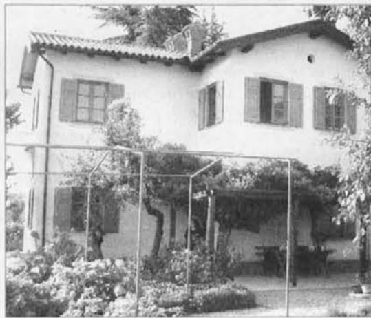
La casa di Kosovel a Tomaj

L'iniziativa del circolo Ivan Trinko a cent'anni dalla