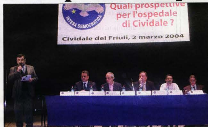
La tavola dei relatori dell'incontro organizzato da "Intesa democratica"

La rete degli ospedali andrà rivista, quando saranno messi nero su bianco i contenuti e la cornice del progetto complessivo si conoscerà anche il destino dell'ospedale di Cividale. E' questo il senso dell'atteso intervento dell'assessore regionale alla sanità Gianni Pecol Cominotto all'incontro organizzato martedì 2 a Cividale dalla coalizione "Intesa democratica" sulle prospettive del nosocomio ducale. L'assessore è partito da una questione generale non irrilevante, la forbice che separa il Prodotto interno lordo dalla crescita della spesa sanitaria in regione, una differenza che impone la scelta di "spendere meglio possibile ciò che abbiamo e proporre ai cittadini modalità di ricerca di nuove risorse". Ma il nuovo piano sanitario, ha assicurato Pecol Cominotto, verrà stilato dopo un confronto con gli enti locali, le scelte saranno fatte nella maniera più condivisa possibile.