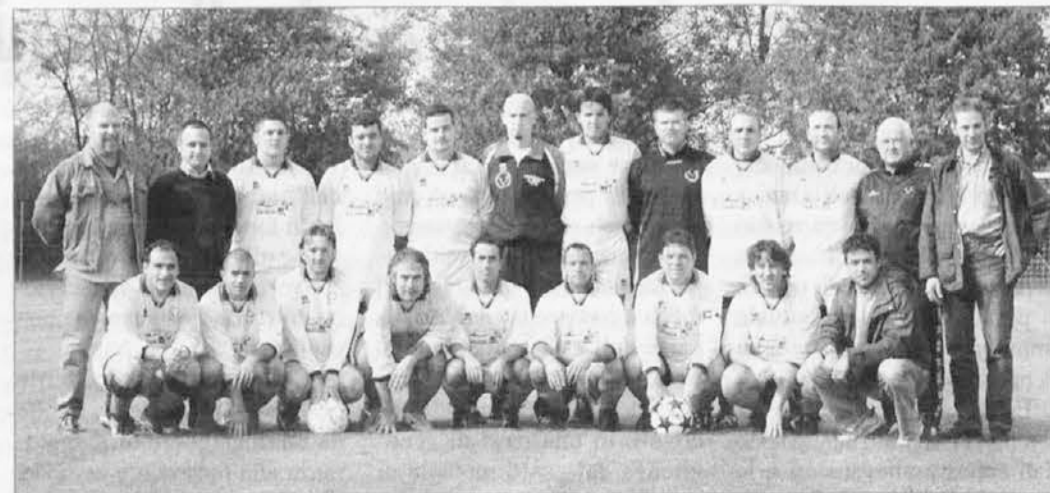
La Polisportiva Valnatisone di Cividale

lo collocava nella porta sguarnita. Al 20' i valligiani triplicavano con Polverino che dopo una velocissima azione concludeva imparabilmente a rete. Due minuti più tardi il Real Feletto accorciava le distanze. A 3' dalla fine del primo tempo Tropina siglava la sua seconda rete personale. Nella seconda frazione di gioco gli ospiti non concedevano nulla agli avversari arrotondando per due volte con Tropina, al 18' e 27', il loro bottino. Domenica prossima la Valnatisone sarà impegnata nella difficile trasferta di Premariacco, ospite della quarta forza del campionato, l'Azzurra. (Paolo Caffi)