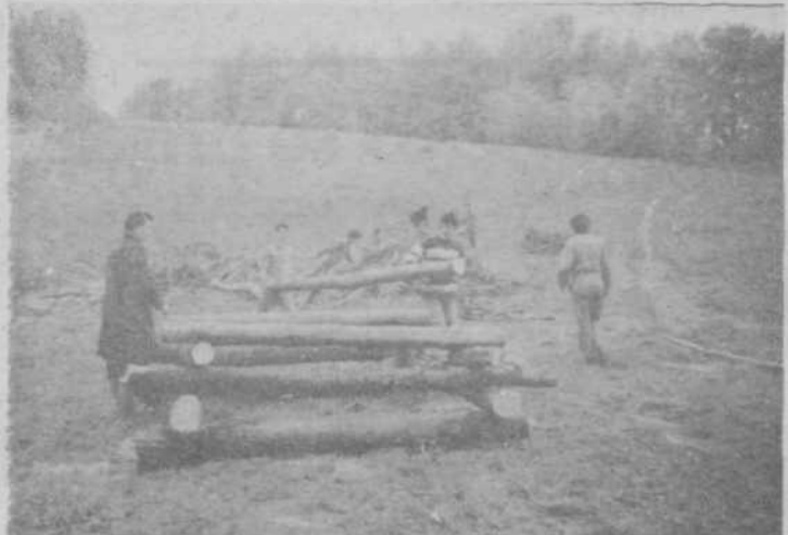
Taborniki taborniškega odreda »Louis Adamič« pri postavljanju kresa

Organizatorji so v to srečanje vložili ogromno truda in napora, žal jih je v dobri meri uničilo slabo vreme. Kljub temu bo Občinski svet ZSS Grosuplje prihodnje leto organiziral 5. srečanje na Polževem (upajmo, da brez dežja).