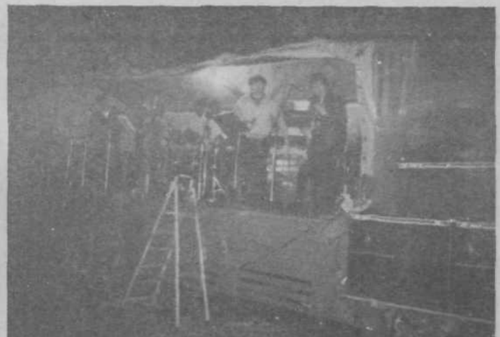
Za zabavo je poskrbel ansambel Veseli Zasavci