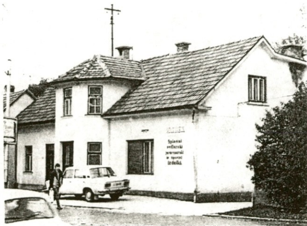
Servis »OREHEK« v Domžalah ni težko najti