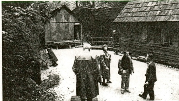
Na izletu v bolnici Franja