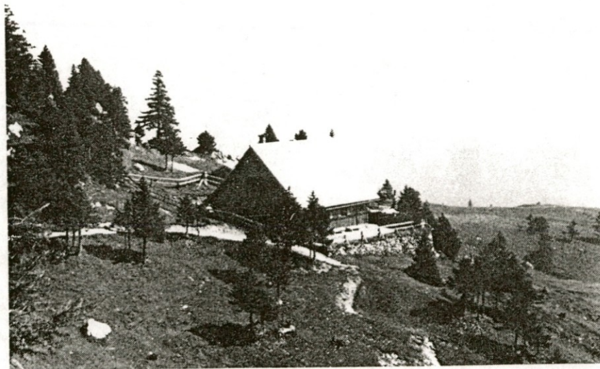
Nova streha doma na Mali Planini se blešči v soncu