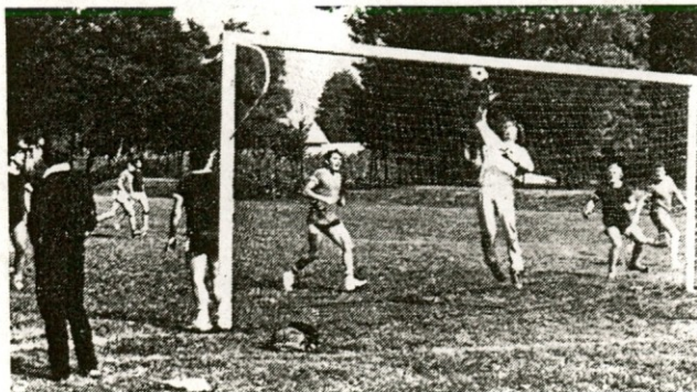
Nogomet: poročeni : neporočeni

Vsi ste na predavanje vabljeni. Vstopnine ni.