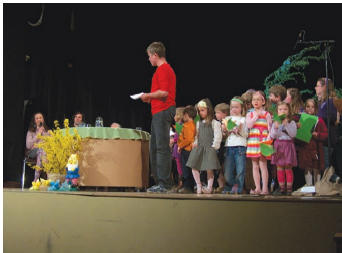
Starševski dan