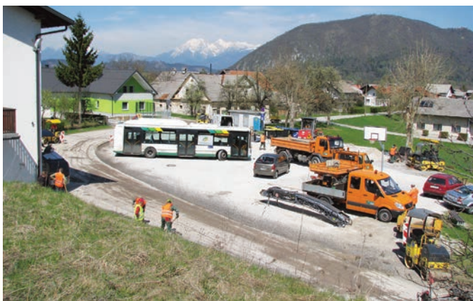
Priloge na asfaltiranje platoja 10. 4. 2012

Obračališče proge je bilo postavljeno v Stanežiče na makadamski plato pred gasilskim domom, na plato, ki so ga v soglasju s takratno Krajevno skupnostjo Stanežiče - Medno in Občino Ljubljana Šiška uredili gasilci PGD Stanežiče-Dvor ob gradnji novega doma leta 1978. Zanj so tudi primerno skrbeli, saj so ga uporabljali kot vaški prostor za prireditve, gasilske vaje in kot parkirišče za obiskovalce.