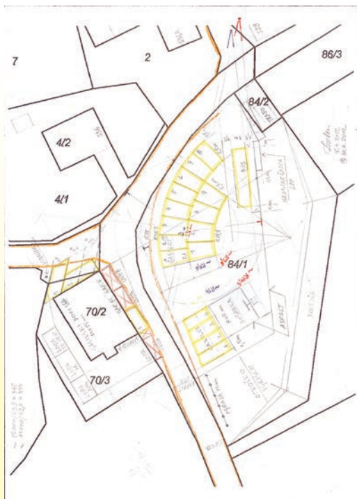
Načrt ureditve platoja pred gasilskim domom