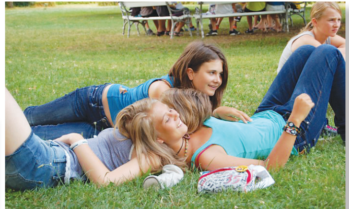
Arhiv: Zavod svetega Stanislav

Vse ostale informacije (program, namen, rok prijave ...) so podrobno opisane na naši spletni strani ( http://www.stanislav.si/pjs/index.htm ).