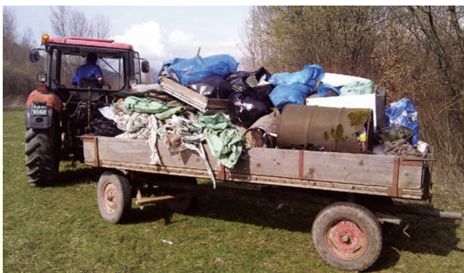
Čistilna akcija

24. marca smo se vključili v vseslovensko akcijo »Očistimo Slovenijo v enem dnevu«. V akcijo se je vključilo veliko število naših društev, našli smo 360 prostovoljcev, če pa prištejemo še šole in vrtece (1859) pa impresivnih 2.200 udeležencev. Zbranih je bilo 180 m 3 odpadkov. Udeležence smo ob zaključku prireditve na rugby igrišču Oval v Gunceljah pogostili z golažem, čajem in vinom ob pomoči kar nekaj donatorjev. Več si boste lahko prebrali v članku v nadaljevanju.