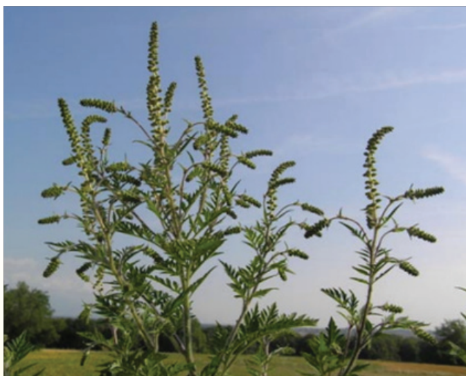
Pelinolistna ambrozija ( Ambrosia Artemisiifolia )

NAHAJALIŠČA: Ambrozija uspeva na zemljiščih s posegi v prostor (deponije, izkopi, gradbišča), kjer druge rastline ne uspevajo, brežinah cest, železnic, vodotokov, kmetijskih zemljiščih, vključno z vrtovi, urbanih površinah (zelenice, parki rekreacijske površine).