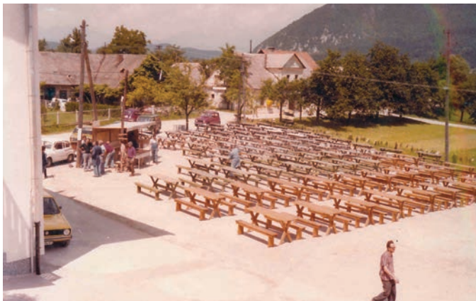
Priloge na otvoritev novega gasilskega doma 22. 7. 1978

V začetku leta 2012 je vaščane Stanežič in Dvora kar malce presenetila uvedba proge mestnega prometa številka 15, Stanežiče–Zgornje Pirniče. Vse se je dogajalo tako hitro, da novici o novi progii niti nismo verjeli, dokler avtobus ni začel voziti.