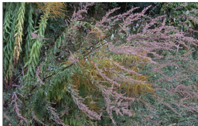
Navadni pelin ( artemisia vulgaris ) in zlata rozga ( solidago gigantea )

nekaj plodov lahko raznesejo ptice ali taljenje snega, lahko pa tudi vodni tokovi, saj plodovi plavajo na vodi. Prenašajo se lahko z mešanico semen za ptiče, sončničnimi semeni, premeščanjem strojev/opreme, prenos s prstjo/gramozom, kompostom.