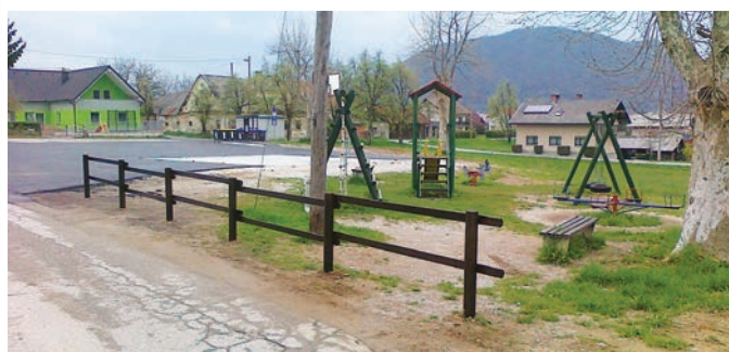
Postavitev ograje ob otroškem igrišču 14. 4. 2012

Na koncu bi se radi zahvalili Mestni občini Ljubljana in Četrtni skupnosti Šentvid za posluš in ureditev platoja pred gasilskim domom v Stanežičah, tako kot smo si želeli že ob otvoritvi doma leta 1978. Za izvedbo in komunikativnost pri urejanju detajlov si pohvalo zaslužijo tudi mestne službe in izvajalci. Leto 2012 si bomo vaščani gotovo zapomnili po uvedbi proge mestnega prometa št. 15, ureditvi platoja in ureditvi statusa otroškega igrišča na tem platoju.