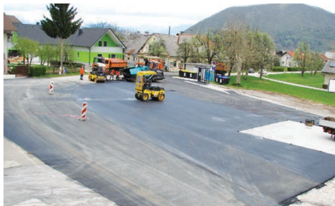
Asfaltiranje 11. 4. 2012

V juniju pričakujemo, da se bo zarisalo še talne oznake vozni površin, avtobusno postajo, parkirna mesta za gasilce, parkirna mesta za obiskovalce in/ali uporabnike avtobusa mestnega prometa.