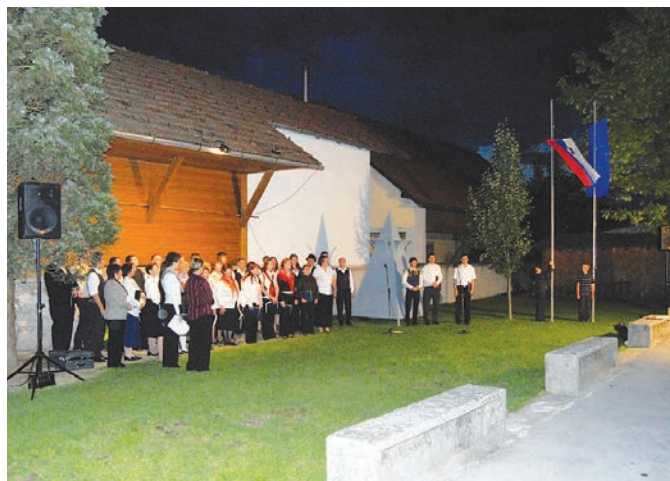
Praznovanje ob dnevu državnosti v Šentvidu

Svet Četrtna skupnosti Šentvid Zapisal Jože Sever