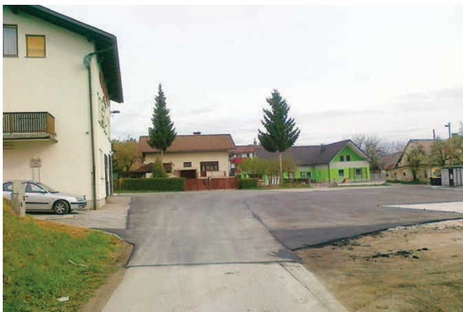
Ureditev platoja pred gasilskim domom Stanežiče

Izjema je prav gotovo asfaltirana ploščad pred gasilskim domom v Stanežičah, kjer smo s pomočjo razumevanja najožjega vodstva Mestne občine Ljubljana, dosegli, da se je uredila ne samo končna postaja mestnega avtobusa št. 15, temveč tudi celotna površina v lasti mestne občine, tako da bo tam mogoče parkiranje in začetek pohoda na Šentviški hrib ali pa morda tudi poti v mesto. Manjka le še pika na »i« – to je zaris parkirnih mest in postavitve ustrezne prometne signalizacije.