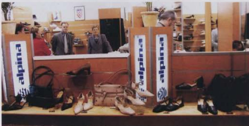
Pomladi je bila prenovljena prodajalna v Zadru.

Po preteku dvaindvajsetih let je tudi Alpinina prodajalna v Zadru prišla na vrsto za prenovo. Prenovili smo jo letos, v mesecu marcu. Ob odhodu dosedanje poslovodkinje Pavice Tokić, je za vodenje prodajalne zadolžena Nada Čakarun.