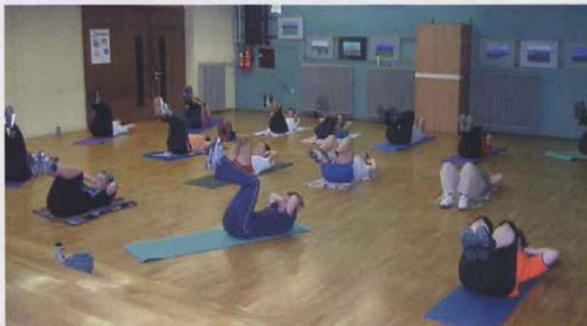
Med aerobiko udeležence izvajajo tudi vaje za trebušno moč.