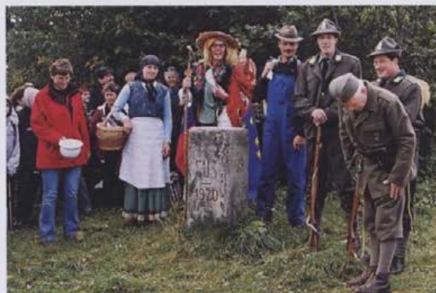
Kaj se je dogajalo ob meji, so prikazali predstavniki Turističnega društva Žiri in Sovodenj