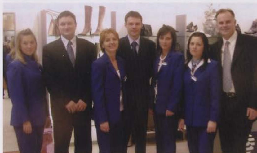
2. decembra je pričela s poslovanjem tudi prodajalna v Mercator centru v Osijeku.

V mesecu novembru smo odprli prodajalno v Metkoviću, kjer še nismo bili prisotni. Upamo, da bo naša obutev dobro sprejeta.