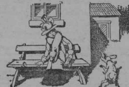
»Mufic odbeži, gospa pa se zadovoljno smeji