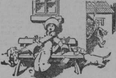
in jo vlečeta, da je groza, gospa pa kriči...