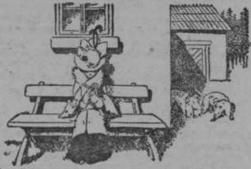
Čez čas se priplazi »mufic s tovarišem nazaj in