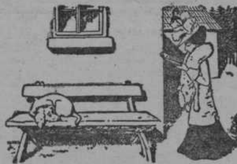
Gospa čita in pride do klopi.